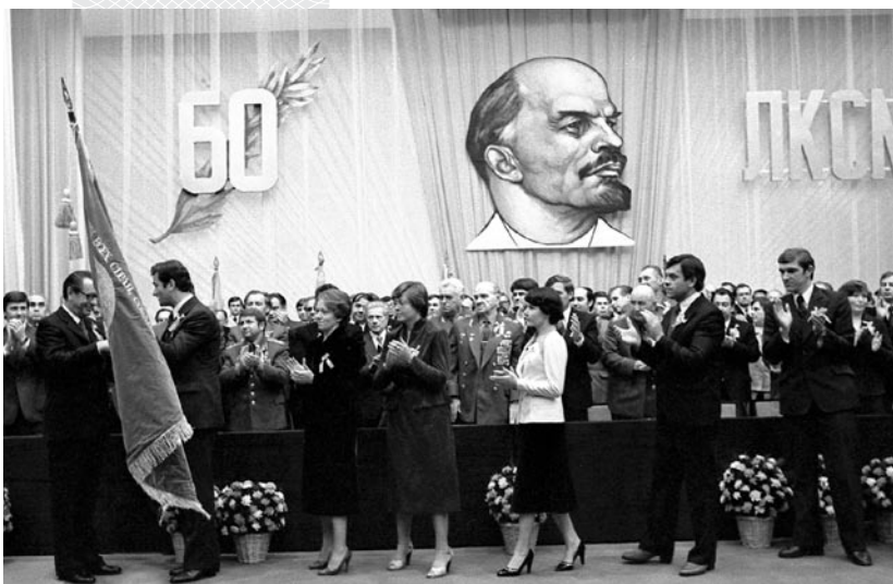
▲ Першы сакратар ЦК КПБ Пётр Машэраў уручае Памятны сцяг ЦК Кампартыі Беларусі рэспубліканскай камсамольскай арганізацыі ў гонар 60-годдзя ЛКСМБ. Верасень 1980 года