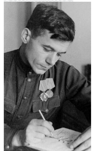
Міхаіл Зімянін. 1944 год