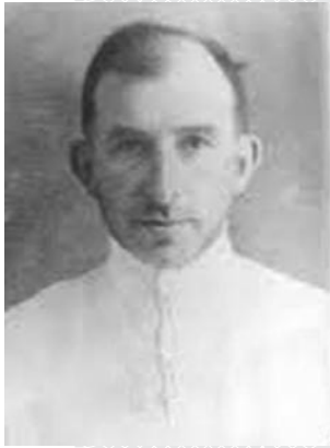
Майсей Ахманаў. Фота 1930-х гадоў

Першы кіраўнік камсамольцаў Беларусі – малады камуніст Майсей Ахманаў. Ён узначальваў ЦК Камуністычнага саюза моладзі Беларусі ў 1918–1919 гадах, затым працаваў на іншых дзяржаўных пасадах у Слуцку, Мінску, Іжэўску, Маскве і Баку. У 1920–1921 гадах першым сакратаром ЦК быў Барыс Цэйтлін, які пасля працаваў у камсамольскіх установах Смаленска, затым – сакратаром ЦК Расійскага камуністычнага саюза моладзі.