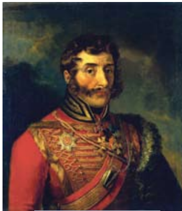
Генерал-лейтэнант Іван Дорахаў

І. Дорахаў. Даўшы адпор ворагу, дорахаўцы ў рэшце рэшт вымушаны былі адступіць на паўднёвы ўсход і неўзабаве апынуліся каля