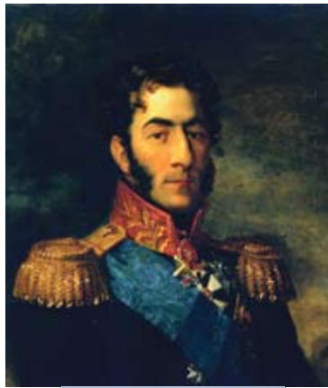
Генерал ад інфантэрыі, у пачатку Айчыннай вайны 1812 года камандуючы 2-й Заходняй арміяй Пётр Баграціён

Тым часам на шляху далейшага адступлення 2-й Заходняй арміі склалася трывожная абстаноўка. Не здолеўшы разграміць М. Барклая-дэ-Толі каля Вільні, Напалеон вырашыў расквітацца з П. Баграціёнам і скіраваў у яго бок свае авангарды на чале з маршалам Л. Даву. Аднак першым на іх натыкнуўся каля Вялікіх Салечнікаў (сучасны літоўскі горад Шальнічынкай. – Аўт. ) ар'ергард 4-га пяхотнага корпуса 1-й Заходняй арміі, якім камандаваў генерал-маёр