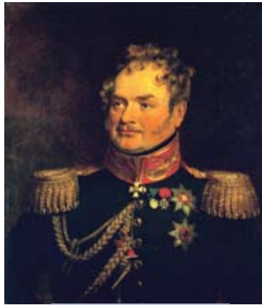
Генерал-ад'ютант Карл Ламберт

Назаўтра, 26 чэрвеня (8 ліпеня), войска П. Баграціёна пакінула Новы Свержань, каб затым, пасля двухдзённага адпачынку ў Нясвіжы, выправіцца ў не менш цяжкі і складаны марш на злучэнне з 1-й Заходняй арміяй, якое адбылося крыху менш як праз месяц, 22 ліпеня (3 жніўня), у Смаленску. І толькі пасля гэтага задума Напалеона, разлічаная на знішчэнне расійскай арміі, пацярпела канчатковы крах.