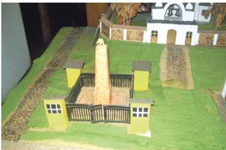
Макет помніка героям Айчыннай вайны 1812 года, зроблены краязнаўцам Г. Пяткевічам

Подоспевшие колонны довершили начатое мной... С рассветом мы уже имели 700 человек пленными нижних чинов, более 10 офицеров и одного полковника, а с нашей стороны потеря состояла из одного офицера, убитого в моем батальоне. Польские офицеры, взятые в плен, спрашивали, где наши войска, которые их атаквали. Мы им сказали: вы их видите всех здесь. И они проклинали своего начальника, не умевшего распорядиться сопротивлением. Жиды обра-