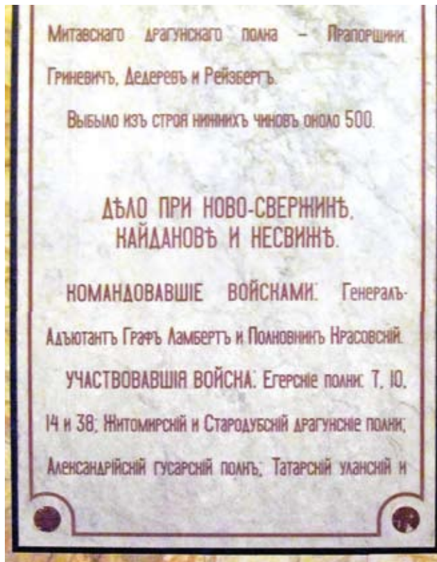
Частка памятнай пліты ў гонар Навасвержанскага бою, устаноўленай на 23-й сцяне «Галерэі вайскай славы» маскоўскага Храма Хрыста Збавіцеля

Аднак, нягледзячы на тэя нягоды, з нагоды 100-гадовага юбілею Айчыннай вайны 1812 года на гандлёвай плошчы Новага Свержання, там, дзе і сёння стаяць адзіныя сведкі апісаных намі падзей – Святаўспенская царква і Петрапаўлаўскі касцёл, на сабраныя тамтэйшымі жыхарамі 2 тыс. рублёў быў устаноўлены помнік рускім салдатам. Выкананы ён быў з чырвонага граніту ў выглядзе чатырохграннай 8-мятровай калоны-абеліска, шпіль якой вянчаў бронзавы двухгаловы арол. На баках п'едэстала гэтага помніка былі высечаны назвы расійскіх вайсковых фарміраванняў, што вызначыліся ў Навасвержанскім баі, а на самой калоне яшчэ і надпіс «Воинам победителям в Отечественной войне 1812 года» [12, с. 90]. Паводле нека-