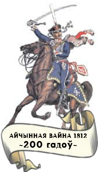
АЙЧЫННАЯ ВАЙНА 1812 ~200 гадоў~

Усе гэтыя стратэгічныя з яго пункту гледжання выгоды Сіротка здолеў скіраваць на сваю карысць. Ён узводзіць у Свержані прыстань і засноўвае верф, на якой пачынае будаваць пласкадонныя рачныя караблі – віціны і стругі. Адначасова, па загаду князя, перайначваецца і вонкавае аблічча паселішча, якое на той час ужо мела статус мястэчка [4]. У 1588 годзе тут паўстаў Петрапаўлаўскі касцёл, а праз два гады літаральна праз дарогу ад яго была закладзена і царква Успення Багародзіцы, шырока вядома пазней сваім чудатворным абразом Маці Божай Свержанскай. Таксама даволі хутка ў мястэчку зашумелі ажно тры млыны, а на нёманскім берэзе з'явілася каля двух дзясяткаў складоў, прызначаных для назапашвання і захоўвання ў чаканні загрузкі на віціны і стругі тавару.