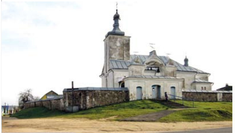
Святаўспенская царква – сведка большасці гістарычных падзей у Новым Свержані

ёсць нямала і трагічных старонак. І перш за ўсё яны звязаны з ваенным ліхалеццем – размешчанае на бойкім гасцінцы і побач з пераправай цераз Нёман мястэчка практычна пад час кожнай варожай навалы зазнавала істотныя страты. Яно было спалена казакамі запарожскага гетмана Івана Залатарэнкі ў час руска-польскай вайны 1654–1667 гадоў, а ў Паўночную вайну з агнём і мячом прайшліся па ім шведы. Падзеі Першай сусветнай вайны таксама не абышлі Новы Свержань, у якім размяшчаліся перад адпраўкай на фронт у раён Баранавічаў рэзервовыя войскі рускай арміі. Пазначана