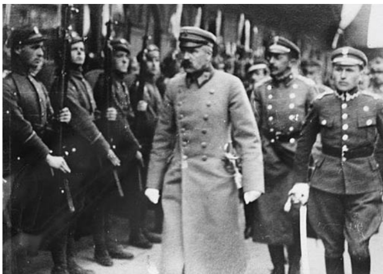
Юзеф Пилсудский в Минске. 1919 год

В нынешней крайне напряженной военно-политической обстановке в Европе и в мире Варшава в который раз одержима в стремлении реализовать великодержавную концепцию «от моря до моря» с генетически устоявшейся антироссийской направленностью. Польское руководство пребывает в плену великодержавной концепции Ю. Пилсудского, увенчанного за свои походы на Москву лавровым венком Стефана Батория. Начальник панской Польши открыто требовал вернуться к границам 1772 года и бесцеремонно заявлял, что его совершенно не устраивала восточная граница по линии Керзона.