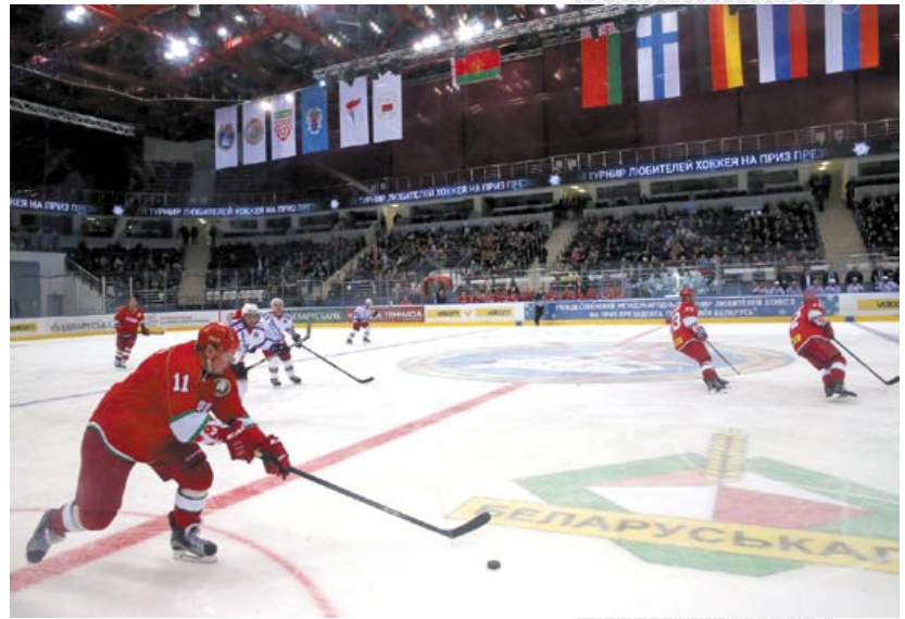
▲ Во время матча на XIII Рождественском международном турнире любителей хоккея на приз Президента Беларуси. 2017 год