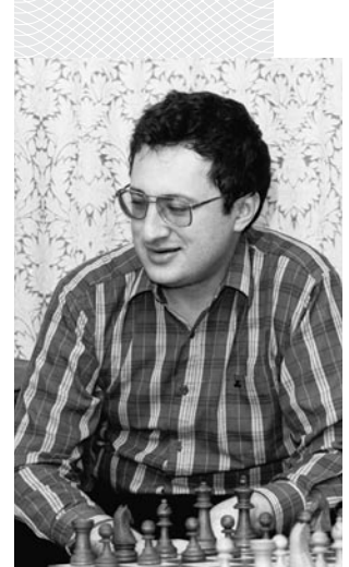
▲ Борис Гельфанд