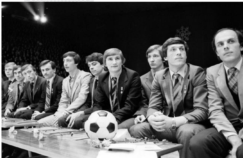
▲ Игроки команды «Динамо» (Минск) – чемпионы СССР 1982 года. Минск. 29 декабря 1982 года