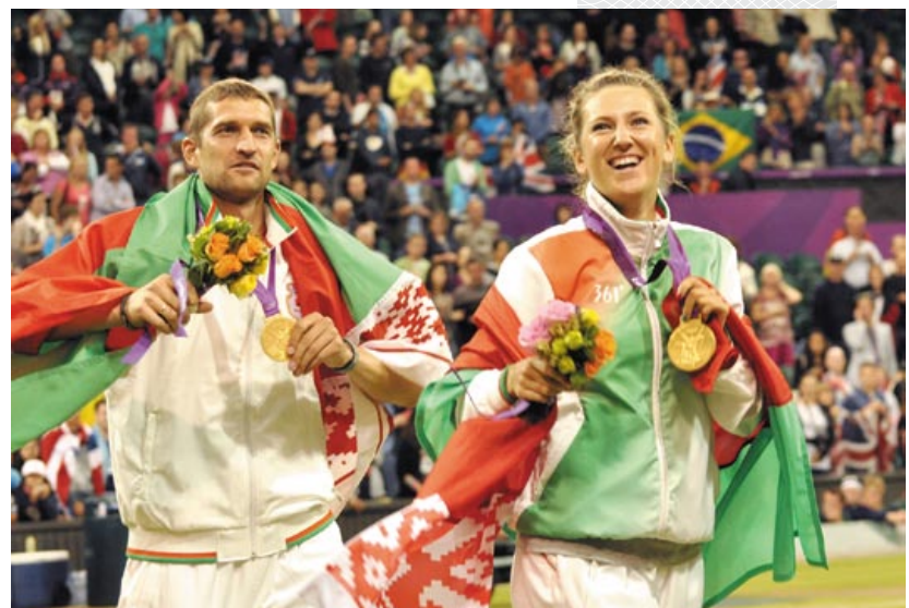
▼ Виктория Азаренко и Максим Мирный на Олимпиаде-2012