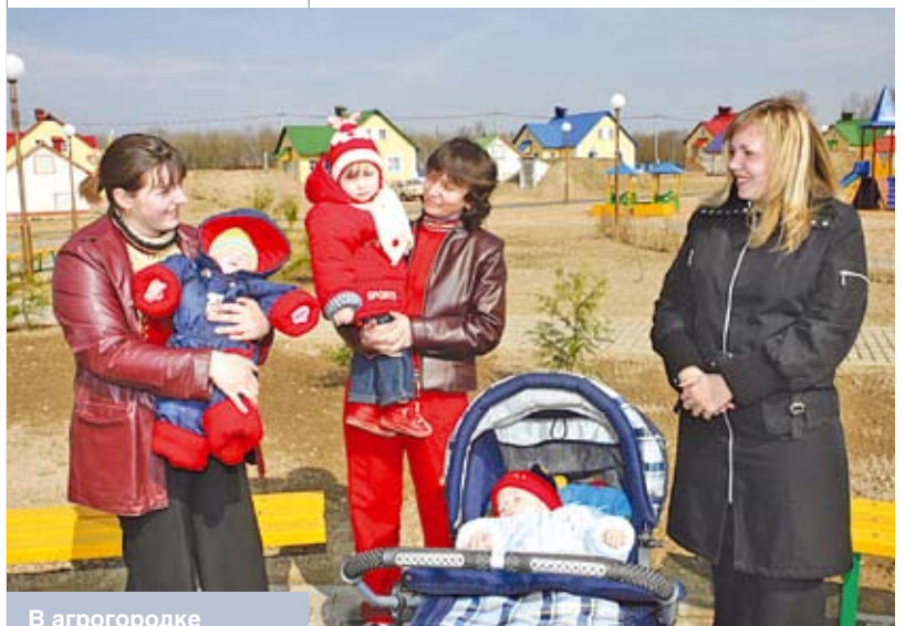
В агрогородке Тимковичи Копыльского района

Если говорить о тематике поднимаемых нашим населением проблем, то она затрагивает все жизненные вопросы. Например, в конце августа – начале сентября люди хотят, чтобы им поскорее предоставили технику для уборки участков с зерном или картофелем. И председатели сельсоветов договариваются с хозяйством, составляют графики. Частенько обращаются жители отдаленных деревень насчет уличного освещения, подсыпки или расчистки дорог... К слову, по агрогородкам, а их в районе 13, обращений поступает меньше всего: там ведь и дороги заасфальтированы, и