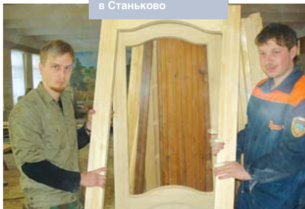
ЧПТУП «Современный подход» – один из многих субъектов малого бизнеса в Станьково

Очень насущный для села вопрос – обеспечение водой. Шахтные колодцы требуют постоянной чистки, ремонта. И качество воды поддерживать на надлежащем уровне все сложнее. Земли хозяйств за последние годы