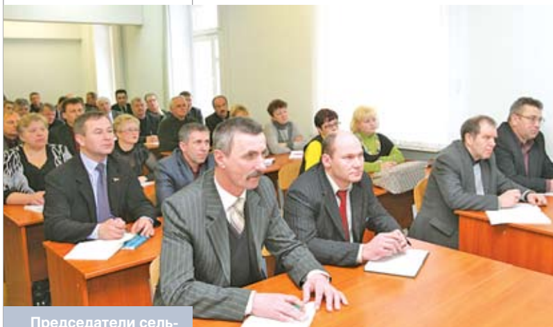
Председатели сельских и поселковых Советов депутатов всех областей участвуют в работе Совета по взаимодействию органов местного самоуправления при Совете Республики. Январь 2010 года

но отнести к работе председателей местных Советов. Без своих депутатов и старост они, конечно, не смогли бы ничего сделать. На минувших выборах в целом по области был избран 4721 депутат, в том числе 60 – в Минский областной Совет. А таких добровольных помощников, как старосты или старейшины населенных пунктов, у наших председателей Советов первичного уровня более 3 тыс. человек. И это действительно сила, объединившая людей неравнодушных, как раньше говорили, людей с активной жизненной позицией.