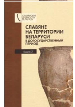
Новейшие научные разработки в сфере археологических исследований, связанных с раннеславянской проблематикой на территории Беларуси, представлены в двух книгах коллективной монографии 2016 года «Славяне на территории Беларуси в догосударственный период: к 90-летию со дня рождения Леонида Давыдовича Поболя».