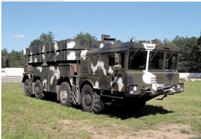
▼ РСЗО «Полонез», 2016 год

История развития суверенного белорусского государства свидетельствует, что его Вооруженные Силы создавались на плановой, всесторонне взвешенной, научно обоснованной базе. Это позволило к 1995 году преобразовать группировку войск Белорусского военного округа в армию самостоятельного государства, осуществить ее поэтапное сокращение до уровня оборонной достаточности, создать нормативно-правовую базу в области обороны. Именно в Беларуси впервые на постсоветском пространстве был выполнен переход на новую организационно-штатную структуру, введен территориальный принцип комплектования Вооруженных Сил, создана национальная система военного образо-