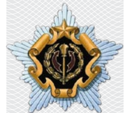
Геральдический знак – эмблема Генерального штаба Вооруженных Сил Республики Беларусь