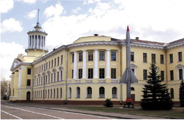
▼ Здание Военной академии Республики Беларусь

Четкое понимание необходимости развития национальной военной школы как элемента обеспечения национальной и военной безопасности, конструктивная позиция руководства Министерства обороны, самоотверженный труд профессорско-преподавательского состава (к слову, по отдельным военным специальностям, таким как тактика, оперативное искусство, стратегия, счет