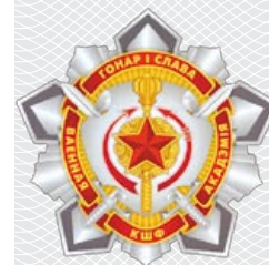
Геральдический знак – эмблема командно-штабного факультета Военной академии Республики Беларусь

Именно отсутствие военно-научной школы на момент обретения Беларусью независимости обусловило особенности ее становления. В конечной цели наука призвана формировать идеи, которые проверяются и внедряются в практику [5]. Однако отечественным военным-практикам пришлось осваивать научный стиль мышления, требующий умения работать с информацией, мыслить системно и логично, выдвигать гипотезы и формировать доказательную базу. По сути, произошла частичная интеграция науки и практики, обусловленная необходимостью принятия управленческих решений на основе опыта, анализа развития обстановки и достижений в данной сфере деятельности.