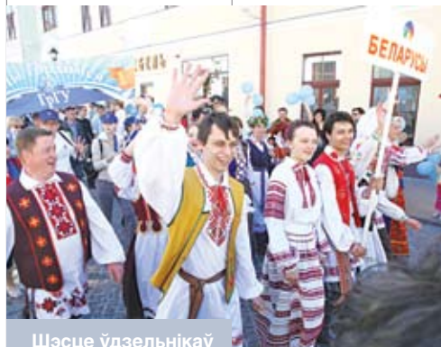
Шэсце ўдзельнікаў Рэспубліканскага фестывалю нацыянальных культур у Гродне. Чэрвень 2010 года