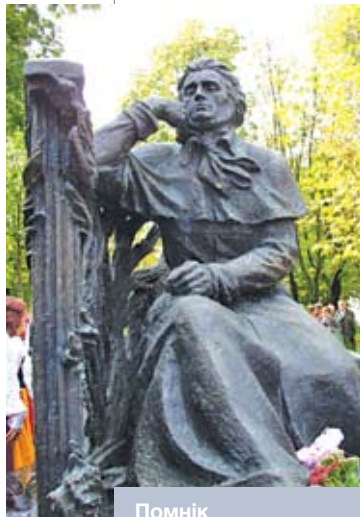
Помнік Адаму Міцкевічу ў Мінску

– І Адам Міцкевіч, і Тадэвуш Касцюшка, а таксама Станіслаў Манюшка, Напалеон Орда (можна яшчэ шмат прозвішчаў назваць) – нашы славутыя землякі. Паўтаруся: землякі, але не беларусы па нацыянальнасці. Не адчувалі яны сябе беларусамі, ніхто іх беларусамі пры жыцці не лічыў, і самі сябе яны да беларускага народа ніколі не адносілі. На «краёвым» (рэгіянальным, субэтнічным) узроўні