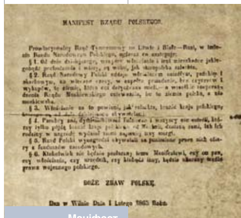
Маніфест Часовага ўрада Літвы і Беларусі на польскай мове. Вільня, 1 лютага 1863 года

любіць яе вышэй за ўсё». У час паўстання 1863 года шляхта Віцебшчыны дэманстравала аналагічную пазіцыю: «З бацькоў і продкаў нашых палякамі з’яўляемся і такімі ў дзеях і нашчадках нашых навечна быць хочам». Невыпадкова падзеі 1863 года ніхто з сучаснікаў нацыянальна-вызваленчым паўстаннем беларускага народа не называў. Як ніхто не называў Вікенція Канстанціна Каліноўскага беларускім нацыянальным героем. Усе сучаснікі скарыстоўвалі зусім іншае азначэнне – польскае паўстанне ў Літве і Беларусі. «Беларусізацыя» Каліноўскага пачалася толькі ў пачатку XX стагоддзя. Таму давайце будзем сумленнымі, прынамсі ў навуковых тэкстах, у дысертацыях, у манаграфіях, у навуковых