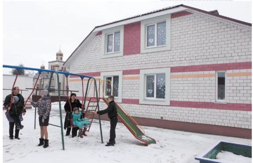
▲ Второй детский дом семейного типа в Ветке. 2016 год

Ветка, приняв на себя удар радиации без содействия мифической авиации, а попав под траекторию движения ветровых потоков, многое потеряла. После аварии по программе отселения из района уехало более 20 тыс. человек: одни получили жилье в других регионах Беларуси, около 8 тыс. выбрали для себя новые места самостоятельно. В районе прекратили существование 60 населенных пунктов, сократились восемь сельсоветов и один городской. Большие потери понесла Ветковщина в