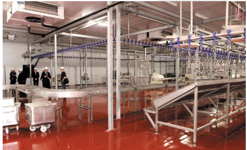
▲ В агрогородке Новоселки Ветковского района готовится к сдаче в эксплуатацию птицефабрика. 2016 год

Полезную и нужную для людей работу делают местные профсоюзы. Например, практикуется заключение контрактов в пределах максимального срока его действия – на 5 лет. Наибольшее количество таких контрактов – в учреждениях обра-