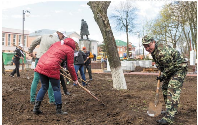
▼ Благоустройство центрального парка и аллеи Героев города Ветки. 2017 год

Нельзя обойти и факт помощи, которую оказывают району из-за рубежа. Особо выделяется немецкий фонд «Жизнь после Чернобыля». Районная больница получила от него три машины «скорой помощи», два аппарата для проведения УЗИ и другое медицинское оборудование. Символично, что в год 30-летия аварии на ЧАЭС неравнодушные люди из Германии приехали в Ветку и заложили под окнами родильного отделения боль-