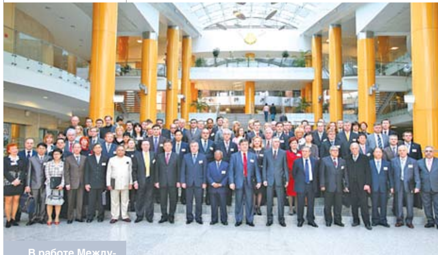
В работе Международного форума судейского сообщества приняли участие руководители и судьи высших судебных органов 20 государств

Так, за этот период многократно возросло количество заключаемых договоров: хозяйственных, гражданско-правовых и так далее. Соответственно, в той же пропорции возросло и число споров, которые возникают при их исполнении. Однако методы их разрешения, применявшиеся в лихие 90-е, сегодня оживают разве что в документальных сериалах на криминальные темы. Зато резко увеличилось количество обращений в хозяйственные суды, что служит