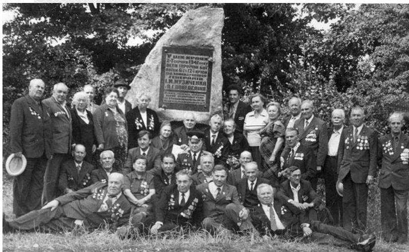
▲ Воины-ветераны 99-й сд 8-го ск у обелиска в память героических боев у Зеленой браны в августе 1941 года. 8 сентября 1984 года

Гитлер приказал отпустить из плена жителей уже оккупированных территорий Украины. Десятки тысяч советских бойцов и командиров, взятых в плен в Подвысоком и Зеленой бране, остались в «Уманской яме», где их ждали муки, голод, жажда и смерть. Местные женщины с разрешения часовых (иногда за взятку) выводили из концлагеря пленных солдат и офицеров, называя их своими братьями, отцами, сыновьями или мужьями. Многие из этих спасенных, восстановив силы и передевшись, уходили на восток.