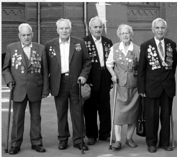
▼ Последние ветераны группы Понеделина в Виннице на последней их встрече в июне 2007 года

Днепра, но переправиться через эту реку сумели очень немногие из них.