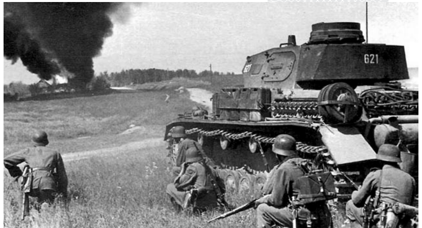
▲ Битва у села Подвысокое. 6 августа 1941 года (немецкое фото)

Бегом через кукурузное поле добрались мы до места приземления «стервятника». Заглянули в кабину – пусто. Невдалеке увидели временный сарайчик (ригу). Интуиция