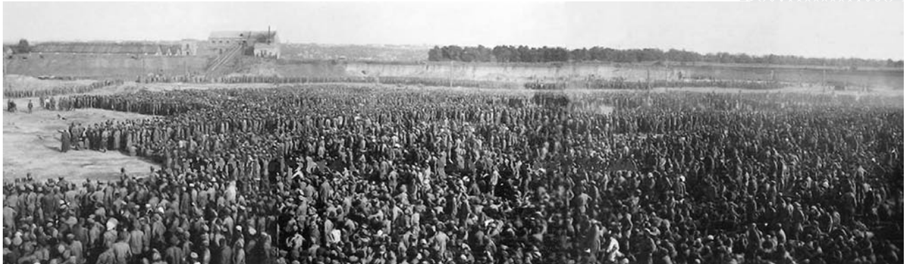
▲ «Уманская яма». Август 1941 года (немецкое фото)