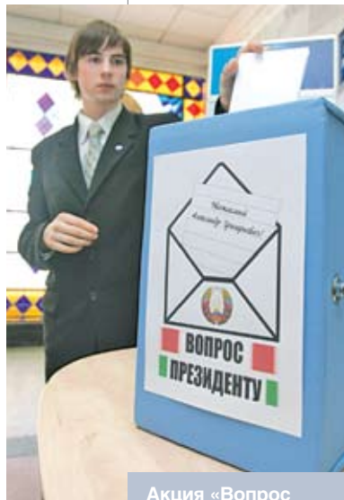
Акция «Вопрос Президенту» в Минском государственном лингвистическом университете. Апрель 2010 года