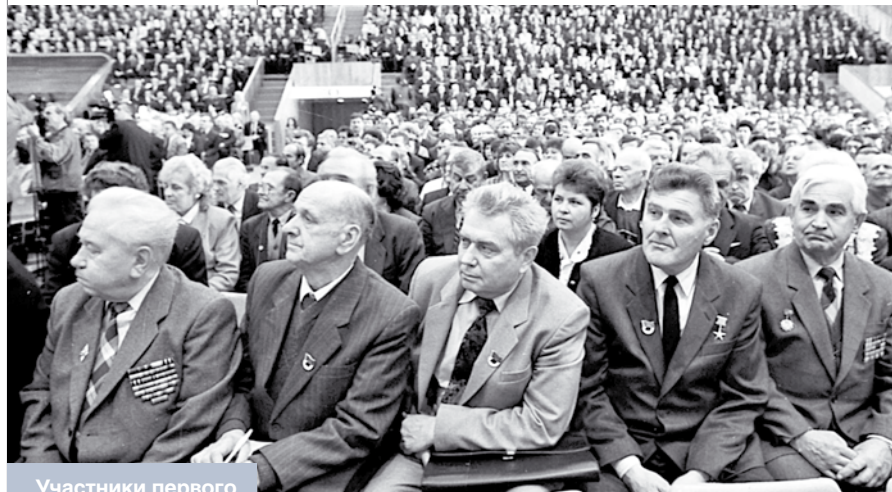
Участники первого Всебелорусского народного собра- ния. Октябрь 1996 года

республики, в которой Президент играл бы исключительно церемониальную роль. В этих условиях 7 августа 1996 года Президент Республики Беларусь А.Г. Лукашенко обратился к Верховному Совету с просьбой провести республиканский референдум 7 ноября 1996 года. По предложению главы государства необходимо было создать Конституционную комиссию, которая подготовила бы новый проект Основного закона, а затем его вынесли бы на республиканский референдум. Стремясь наиболее полно обеспечить участие широких слоев населения в обсуждении волнующих общество проблем, принимаемых высшим руководством