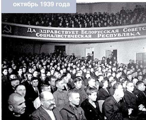
Заседание Народного собрания Западной Беларуси. Белосток, октябрь 1939 года

было там и постоянных органов власти. Право выдвижения кандидатов предоставлялось крестьянским комитетам, временным управлениям городов, собраниям рабочих на предприятиях, бойцам рабочей гвардии (созданной для поддержания порядка и самообороны),