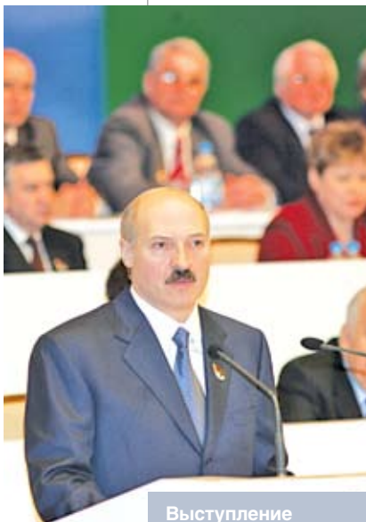
Выступление Президента Беларуси Александра Лукашенко на третьем Всебелорусском народном собрании. 2 марта 2006 года

Представляют интерес следующие цифры и факты, характеризующие состав участников собрания. По информации районных, городских, областных организационных комитетов по подготовке и проведению Всебелорусского народного собрания, избрано 4740 участников. Обеспечено представительство всех районов и городов,