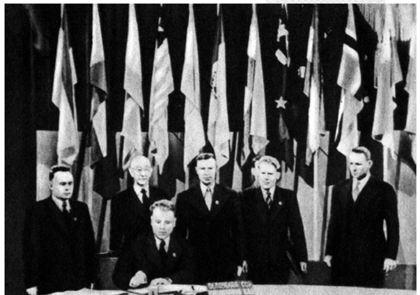
▼ Дэлегацыя БССР падпісвае Статут ААН

1 мая генеральны сакратар канферэнцыі А. Хіс накіраваў з Вашынгтона тэлеграму