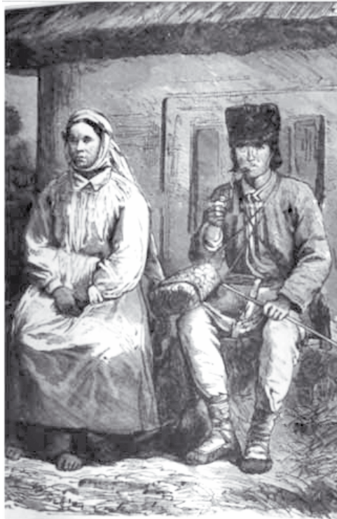
Белорусы Минской губернии. Из «Иллюстрированной энциклопедии народов России». СПб, 1877 год

Эти тенденции способствовали зарождению у части местной интеллигенции стремления к созданию отдельной национальной культуры на белорусской сельской этнографической основе. Парадоксальным образом белорусское движение имело как «русские», так и «польские» корни. Интенсивные этнографические и исторические изыскания в русле западнорусизма дали обильный фактологический материал для зарождавшегося белорусского движения. Первоначально эти тенденции развивались в русской парадигме, которая, однако, обрела все более децентрализованный характер. Зазвучали мысли о возможности несколь-