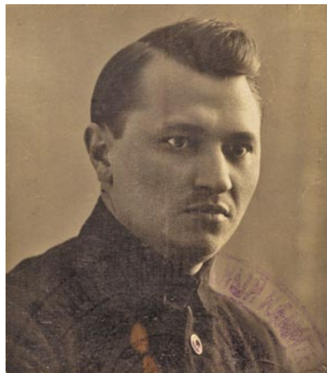
Д.Ф. Прышчэпаў. 1920-я гады

У кастрычніку 1929 года Дзмітрый Прышчэпаў быў адпраўлены на працу ў Мазырскую акругу. Яго пераемнік на пасадзе наркама земляробства БССР П. Рачыцкі сваім загадам прызначыў Д. Прышчэпава загадчыкам Палескай