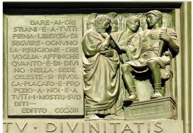
▲ Один из бронзовых барельефов, иллюстрирующих фрагменты Миланского эдикта, на дверях Миланского собора

Акцент на роли личностных качеств человека и его творческих потенций как мотивирующего фактора инновационной деятельности в прошлом и настоящем является достаточно распространенным среди исследователей. Действительно, трудно переоценить роль инноваций в общественно-историческом процессе, поскольку инновация – это базисный потенциал развития общества и челове-