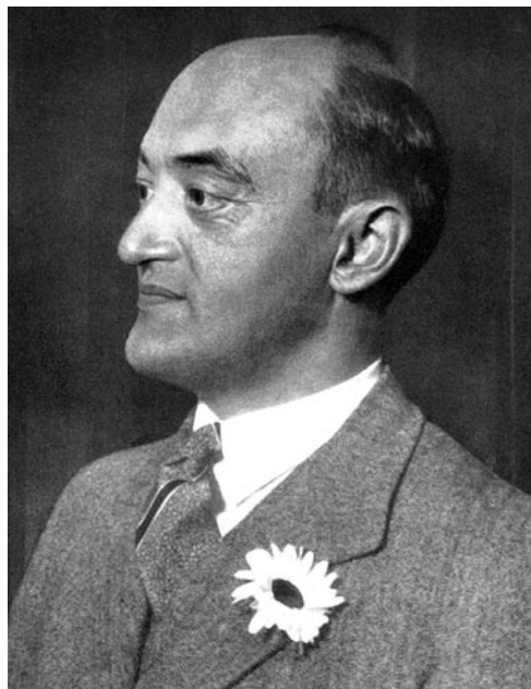
◀ Австрийский экономист Йозеф Шумпетер

На этом основании он делает вывод, что инновации могут быть экономическими и социальными. Модераторами экономических новшеств являются, по мнению Й. Шумпетера, предприниматели – энергично деловые люди своего рода менеджеры, причем из нарратива австрийского ученого логично следовало