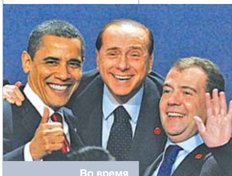
Во время саммита G8 в Лондоне. Апрель 2009 года

Во-первых, страны, входящие в эту сферу, не должны присоединяться ни к каким военно-политическим и экономическим союзам, в которых не состоит Российская Федерация. Отсюда и столь решитель-