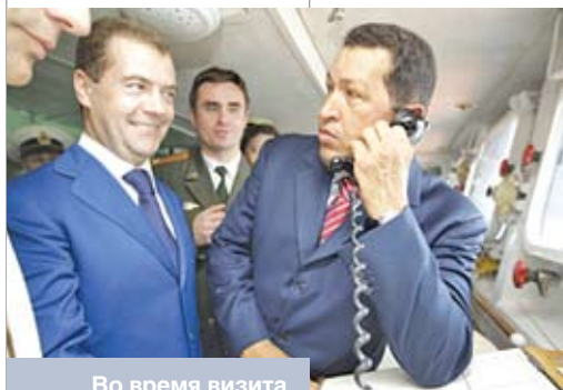
Во время визита Дмитрия Медведева в Венесуэлу. Ноябрь 2008 года

Определенную тревогу при оценке внешней политики России вызывает ее гипертрофированная персонификация. Немецкое словечко Realpolitik весьма расхоже в российских властных элитах, там любят подчеркивать свой прагматизм. На деле же иногда складывается ощущение, что руководители России занимаются гаданием на ромашке: «Любит, не любит. Нравится, не нравится». Внешняя политика, основанная