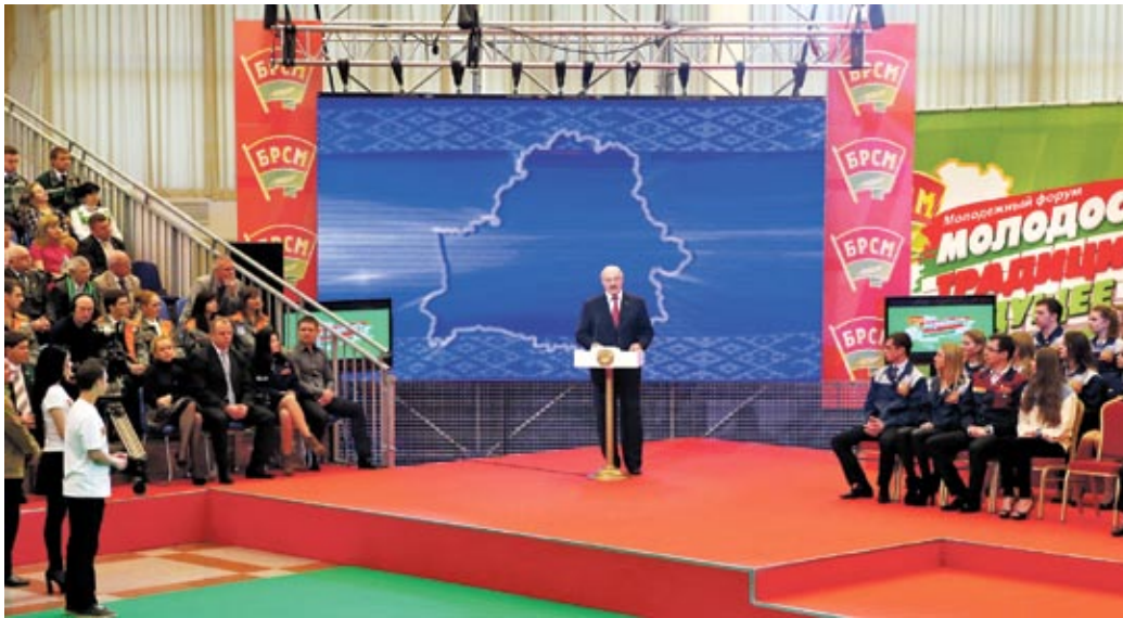
◀ Александр Лукашенко на молодежном форуме «Традиции. Молодежь. Будущее». 2013 год

которых БРСМ, Белорусская Ассоциация клубов ЮНЕСКО, Лига добровольного труда молодежи, Ассоциация белорусских гайдов и другие.