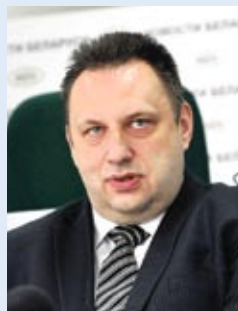
Виктор ЯКЖИК, заместитель министра образования Республики Беларусь:

– Беларусь проводит целенаправленную государственную молодежную политику. Государством создаются все условия, чтобы каждый молодой человек мог реализовать себя в различных сферах – на производстве, в бизнесе, науке, искусстве, спорте, общественной жизни. Ежегодно страна вкладывает колоссальные ресурсы в развитие подрастающего поколения: от получения образования до предоставления первого рабочего места. Плановмерно осуществляется социальная поддержка молодежи, многодетных семей. Особое внимание уделяется талантливой и одаренной молодежи, развитию молодежной инициативы и формированию лидерских качеств.