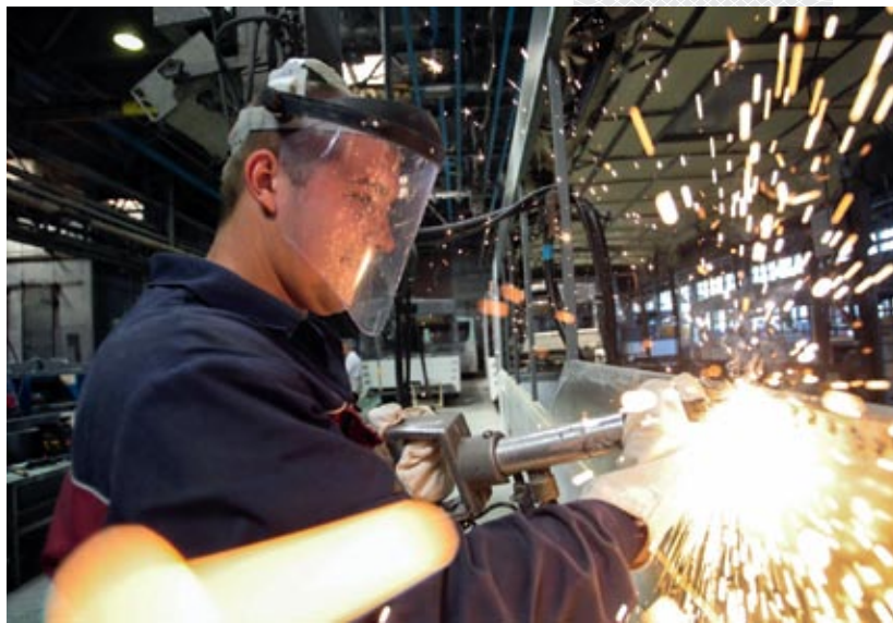
▲ На автобусном производстве МАЗа. 2015 год

Есть только один критерий оценки работы – ее результат. С точки зрения сохранения жизни и здоровья человека труда сложно переоценить важность документа, который вступил в действие в марте 2004 года, – президентской Директивы № 1 «О мерах по укреплению общественной безопасности и дисциплины». За минувшее десятилетие численность работников, пострадавших на производстве, в нашей стране уменьшилась в три раза, количество погибших – в