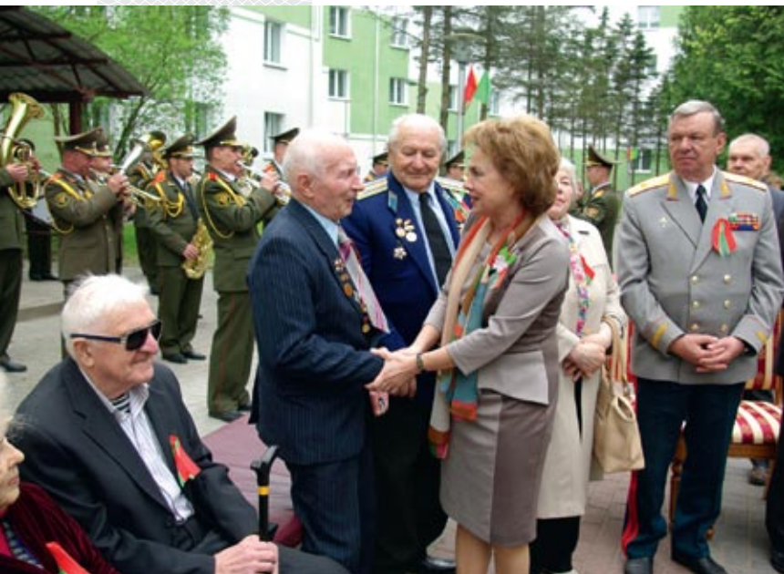
▲ Праздничная встреча в Республиканском интернате ветеранов войны и труда 6 мая 2015 года

укрепляется и совершенствуется система медицинской реабилитации, принимаются меры по развитию и модернизации отечественной реабилитационной индустрии, развитию художественного творчества, физической культуры и спорта среди инвалидов, выполняются работы по созданию безбарьерной среды на социальных объектах, в жилом секторе, дорожно-уличной сети, улучшается информированность общества об основных проблемах инвалидов и имеющихся возможностях их решения.