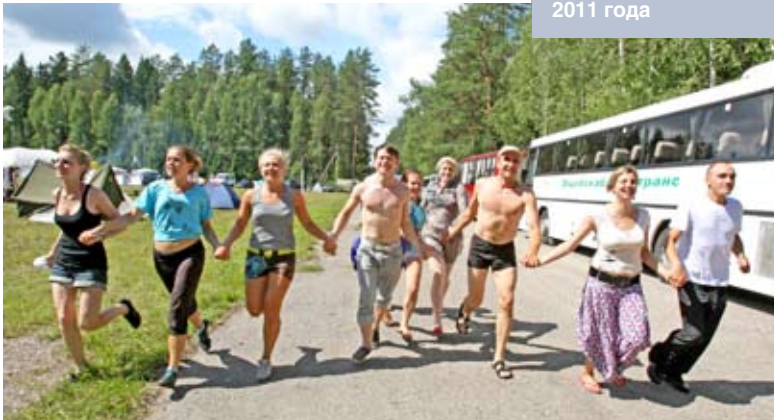
Около 600 активистов молодежного движения из Беларуси, России и Латвии приняли участие в работе международного лагеря «Be-La-Русь» в Верхнедвинском районе Витебской области. Июль 2011 года

Определенные возможности активизации работы в этом направлении заключены в такой структуре, как Совет руководителей