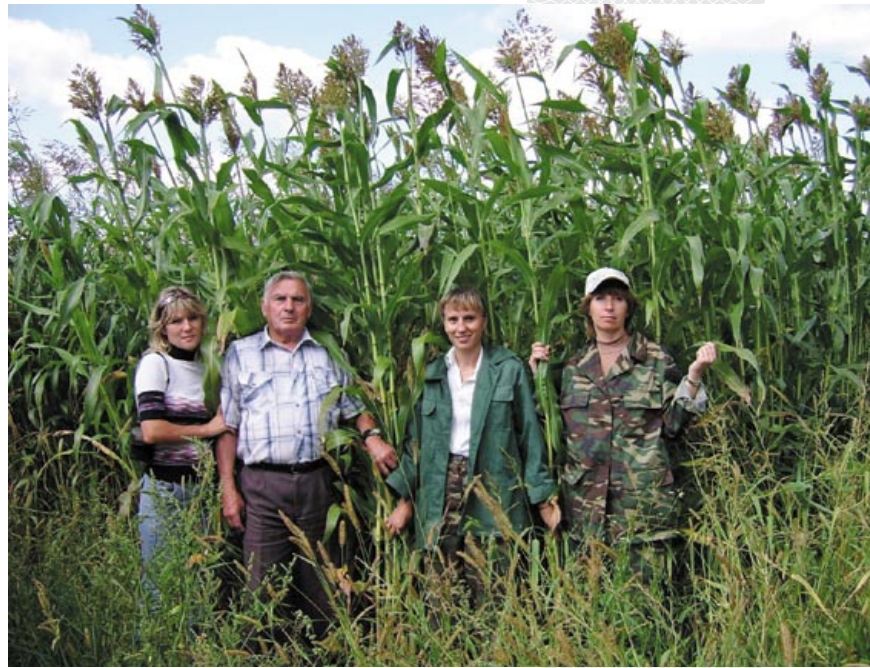
▲ Такими урожайными могут быть сорговые культуры. Экспериментальные посева

Г. Седукова рассказала, что в первый период после чернобыльской катастрофы учеными было рекомендовано исключить бобовые культуры из структуры посевных площадей на территории радиоактивного загрязнения по причине высоких коэффициентов перехода радионуклидов в продукцию. Однако это обусловило недостаток белка в кормовых рационах животных. Кроме того, бобовые культуры обогащают почву биологически связанным азотом, обеспечивая возможность уменьшения применения минеральных азотных удобрений и спо-