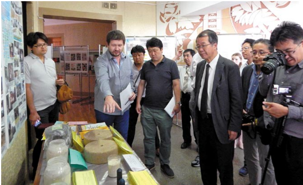
◀ Ученые Института радиологии представили свои разработки делегации из Японии. 2017 год

базе местных центров практической радиологической культуры. Первоначально в 1990-х годах их было создано порядка 400: в наиболее загрязненных районах они открывались на ФАПах, фермах, в школах и проч. Оснащались радиационно-техническим оборудованием, так как основной задачей тогда была организация постоянного контроля за загрязнением продукции. В настоящее время количество центров снизилось до трех десятков, да и на повестке дня вырисовалась другая проблема. Местные жители один раз принесут проверить и убедиться, что все хорошо по показателям радиоактивности, другой, а потом совсем перестают посещать центры практической радиологической культуры.