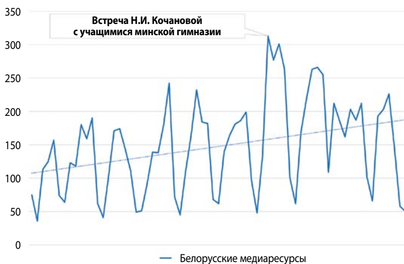
Рисунок 3. Статистика публикаций по запросу «Молодежь Беларуси» с использованием АИС БИСИ InfoMetrix (с 1 января 2024 года по 10 марта 2024 года)

– анализ информационного поля. Изучение медийного восприятия способствует формированию представления о ключевых акцентах подачи и восприятия информации аудиторией (рис. 3);