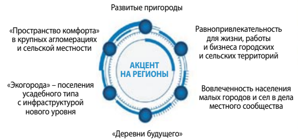
Рисунок 1. Матрица анализа аналитического проекта БИСИ «Образ будущего»