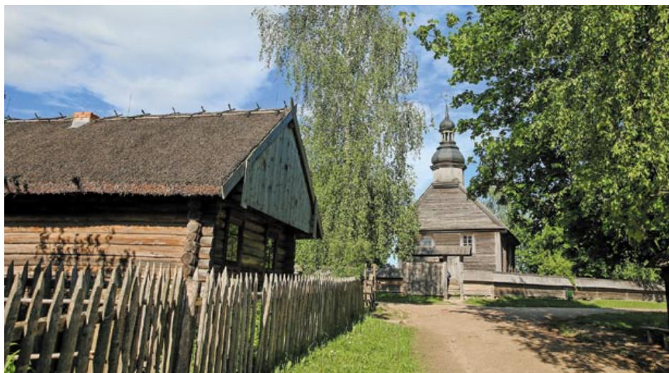
Решение о создании Белорусского государственного музея народной архитектуры и быта – единственного в нашей стране этнографического комплекса под открытым небом, было принято 9 декабря 1976 года

– Приходилось работать на энтузиазме, – вспоминает академик. – Объекты деревянного зодчества собирали по всей Беларуси в разных деревнях, своими руками разбирали буквально по бревнам, сами грузили в «шаланду» – длинномерный автомобиль-тягач, везли в Строчицу, где разгружали. Помню, в октябре под дождем копал фундамент под здание пилорамы, которую планировали там построить... Нам было важно сохранить и представить уникальные памятники истории и культуры в близкой к естественной среде, в единстве ее региональных и локальных особенностей и таким образом, через музейный мир, донести память предков.