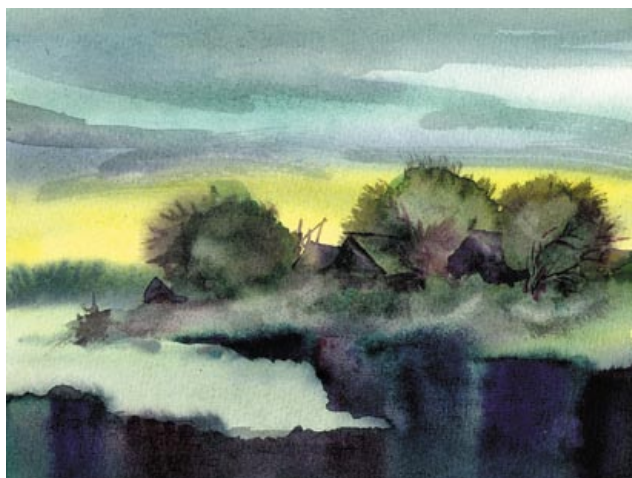
Оттепель. 1991 год