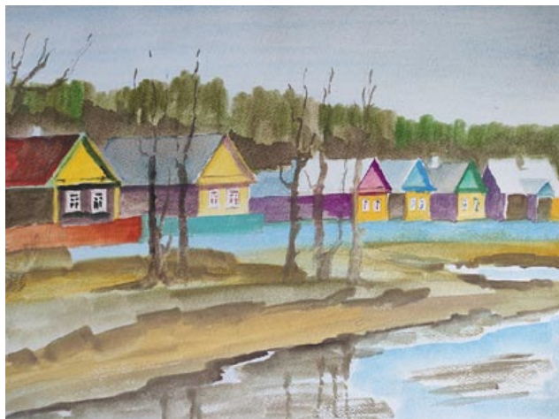
Деревня Бурносы. Домов веселый хоровод. 2021 год