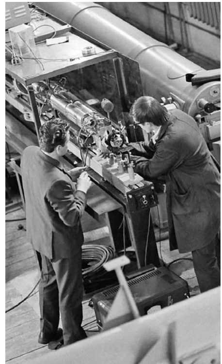
В лаборатории Института физики. 1972 год

Масштабные экономические преобразования были невозможны без науки и научного поиска. В 1970-х годах в БССР разрабатывали важнейшие компоненты космических программ, обеспечивали большой объем заказов военно-промышленного комплекса. А еще республика была пионером в оптических исследованиях, лазерной физике и технике, по ряду направлений электроники.