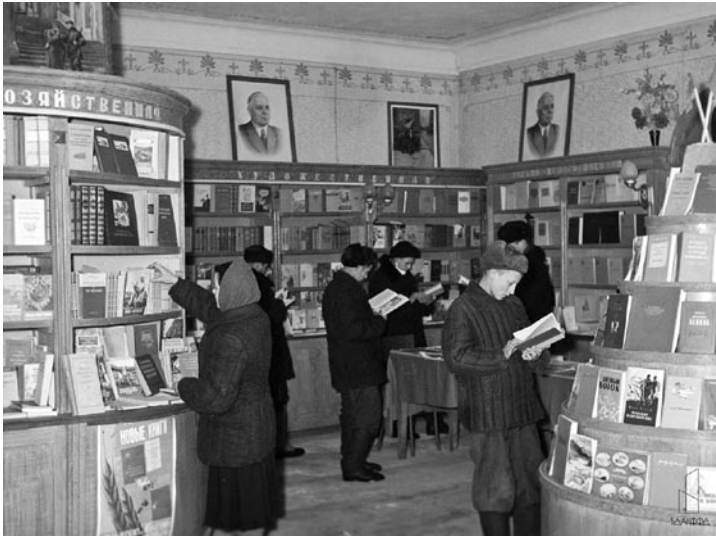
В книжном отделе культмага райпотребсоюза. 1957 год