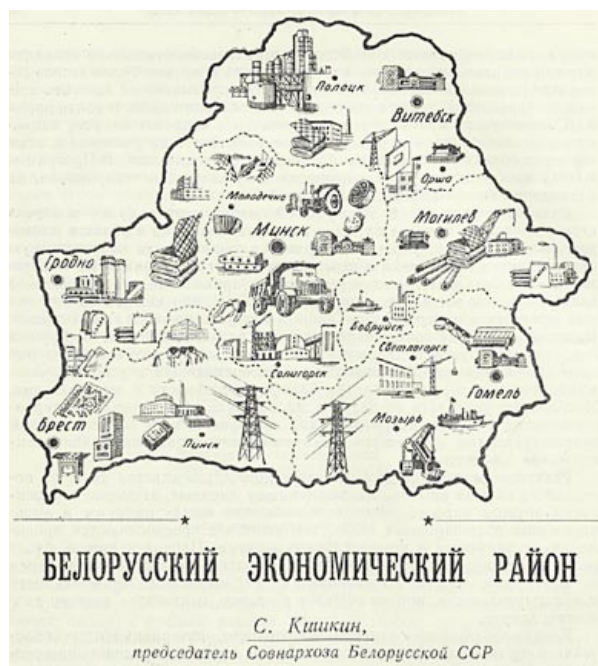
В 1960-е годы шел бурный рост промышленности. Карта в журнале «Коммунист Белоруссии» показывает масштабы и географию промышленных гигантов. 1963 год

предлагает председатель Совнархоза Белорусской ССР С. Кишкин. – ...Устремляются ввысь копры Солигорских копей, причудливые сооружения Полоцкого нефтегиганта, Гродненского азототукового завода и многих других новостроек. Яркими огнями светятся здания могучих Березовской и Василевичской электростанций.