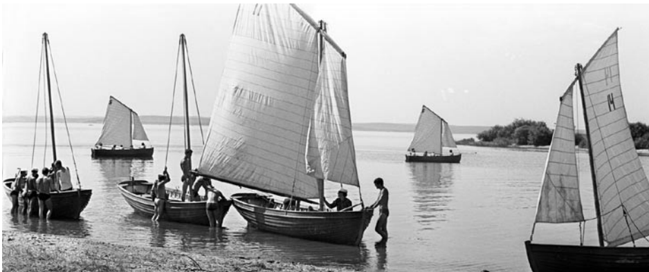
Заславское водохранилище является вторым по величине искусственным водоемом в Беларуси. На Минском море. 1969 год

«Вглядитесь в карту нашего экономического района и перед вашим мысленным взором встанет преобразуемая трудом миллионов белорусская земля, –