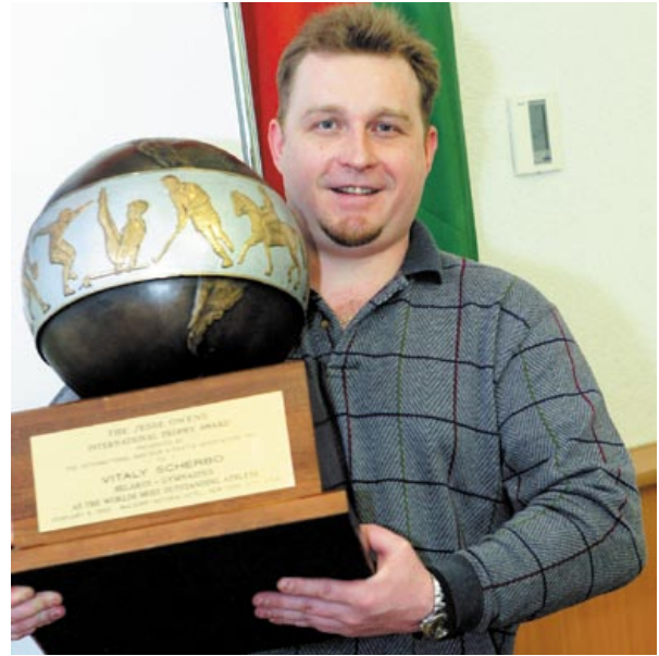
Шестикратный олимпийский чемпион Виталий Щербо – лучший спортсмен мира 1992 года по версии МОК. 2005 год