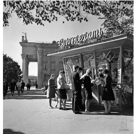
Продажа утренних газет и журналов в г. Гомеле. 1964 год

ключительно в бравурном свете, что обусловило определенное недоверие слушателей. Эта проблема особенно обострилась в годы перестройки, считает автор.