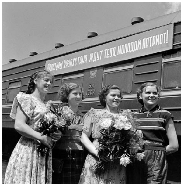
Комсомолки из Гродно отправляются в Казахстан на стройки VI пятилетки. На перроне Минского вокзала. 1956 год

Автор вспоминает, как 6 марта 1954 года начал работу XVIII съезд комсомола Белоруссии, а вечером делегаты съезда горячо приветствовали первую группу комсомольцев, изъявивших желание ехать на освоение целины. «Мы собрались здесь, чтобы приветствовать и проводить в славный путь на освоение целинных земель