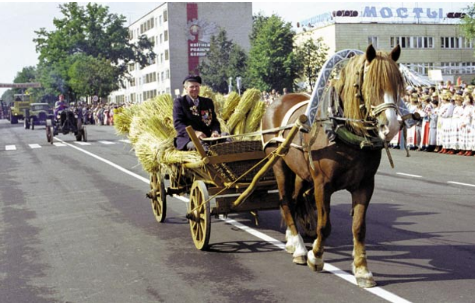
Праздник урожая «Дажынкi» в Мостах Гродненской области. 1997 год

Беларусь А.Г. Лукашенко в 1996 году прошел первый фестиваль-ярмарка «Дажынкi», ставший настоящим праздником для работников АПК. Эта красивая традиция идет из глубины народной культуры и прославляет человека-труженика и сегодня.