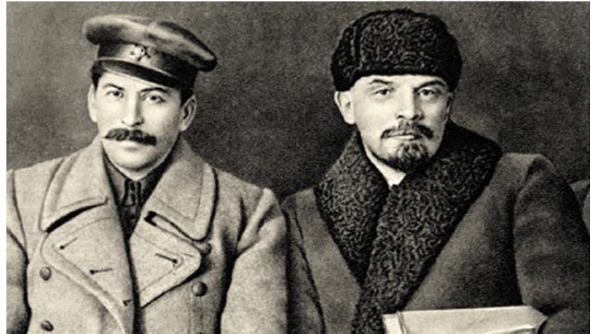
▲ Наркам РСФСР па справах нацыянальнасцей І. Сталін і старшыня Савета народных камісараў РСФСР У. Ленін. 1919 год

Высновы, падобныя да гэтай, рабіліся галоўным чынам на той падставе, што працоўныя і камуністы краю не выступалі ў падтрымку ідэі ўтварэння беларускай