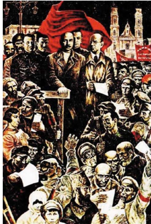
◀ Карціна Леаніда Дударэнка «Мінск, 1919». 1977 год

Нацыянальная палітыка савецкага ўрада ў раёнах, якія вызваліліся з-пад улады германскіх акупантаў, патрабавала істотнай карэкцыроўкі. Ануляваўшы 13 лістапада 1918 года Брэсцкі мір, Усерасійскі цэнтральны выканаўчы камітэт прызнаў за працоўнымі ўсіх народаў права на самавызначэнне і заклікаў працоўных Расіі, Ліфляндыі, Эстляндыі, Польшчы, Літвы, Украіны, Фінляндыі, Kryма і Каўказа самім вырашаць свой лёс. 29 лістапада 1918 года ў дасланай тэлеграме Ленін патрабуе ад Галоўкама Рабоча-сялянскай Чырвонай