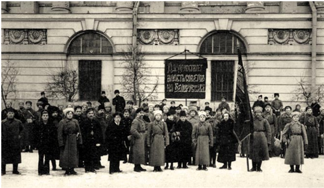
◀ Камандаванне 1-га Беларускага камуністычнага атрада і супрацоўнікі Петраградскага аддзела Белнацкама ля Публічнай бібліятэкі ў Петраградзе. 1919 год

адносінах, паколькі прызнаем права на самавызначэнне» [2, арк. 5]. Усё гэта прымушала Мінгубрэўкам ставіць пытанне аб статусе Мінскай губерні і, шырэй, Беларусі і Літвы ў складзе Савецкай Расіі. 12 снежня 1918 года нарада сялянскіх дэпутатаў Мінскай губерні выказалася за хутчэйшае скліканне ў Мінску з'езда Саветаў Беларусі і Літвы, які вырашыць усе пытанні дзяржаўнай будовы Савецкай Беларусі і Літвы [17, с. 439]. Грунтуючыся на пастанове губернскай сялянскай нарады, 20 снежня 1918 года Мінгубрэўкам, мінаючы Аблвыканкамзах, звярнуўся непасрэдна да старшыні УЦВК Я. Свядлова з прапановаю стварыць Беларускаю і Літоўскую Працоўную Камуну ў федэратыўнай сувязі з РСФСР. На думку старшыні Мінгубрэўкама І. Рэйнгольда, такі крок патрабаваўся найперш «у інтарэсах недапушчэння абдурвання рабочых Антанты», паколькі лідары БНР, якія з'ехалі за мяжу, «будуць выдаваць сябе прадстаўнікамі дэмакратычных мас Беларусі, быццам бы задушаных сілай савецкіх войскаў» [14, с. 60–61].