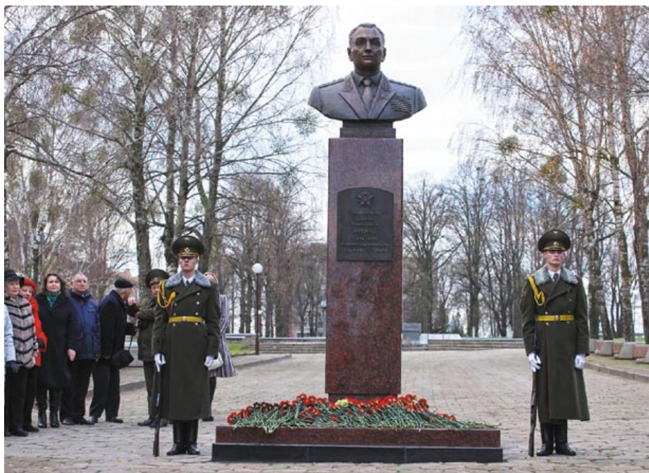
Памятник-бюст уроженцу Гродно генералу Алексею Антонову торжественно открыли 5 ноября 2021 года в Гродно

Весьма символично, что последние семь лет своей жизни (1955–1962) А.И. Антонов был первым начальником штаба Объединенных вооруженных сил Варшавского Договора. Остается открытым вопрос: почему Алексею Антонову не присвоили звание «Маршал Советского Союза», которого он был действительно достоин? И сегодня военные историки не могут точно ответить на этот вопрос. Заслуживает внимания точка зрения генерал-полковника Д.А. Волкогонова, высказанная им в 1990 году: «Маршалом Советского Союза Антонов так и не стал, несмотря на благожелательное отношение к нему Верховного. В дело вмешался Берия... Однако Берии нужна была опора в армии. Он видел быстрое