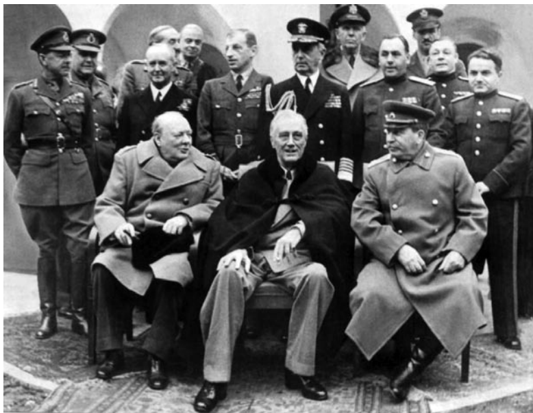
Алексей Антонов участвовал в работе Ялтинской конференции. На снимке: второй справа во втором ряду. 1945 год

Пожалуй, Антонов, одаренный штабной работой крупного масштаба, оказал на Сталина не меньшее влияние, чем Шапошников, Жуков и Василевский. Дело в том, что высокая штабная культура, организованность, продуманность как главной идеи, так и мелочей очень imponировали Сталину. Теперь рядом с ним работал человек, который по своему предназначению должен был все раскладывать «по полочкам» и делал это впечатляюще, а главное, эффективно» [1, с. 341, 343].