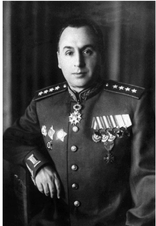
Алексей Иннокентьевич Антонов. 1945 год

В краткой биографической справке «Антонов Алексей Иннокентьевич» утверждается, что он «окончил Военную академию им. М.В. Фрунзе в 1931 году» [5, с. 59], а в июне 1941 года стал генерал-майором (в действительности – 4 июня 1940 года. – Э.И.). В этом утверждении также отсутствует два слова «командный факультет» Военной академии имени М.В. Фрунзе. Дело в том, что в мае 1933 года Алексей Иннокентьевич окончил еще и оперативный факультет этой же академии. В той же краткой биографической справке отмечается, что А.И. Антонов в 1937 году окончил Военную академию Генштаба. Это ошибочное утверждение повторяется и в статье Маршала Советского Союза С.Ф. Ахромеева [6, с. 169]. В действительности, он окончил только первый курс данной академии, потому что после окончания первого курса Алексея Антонова назначили начальником штаба Московского военного округа.