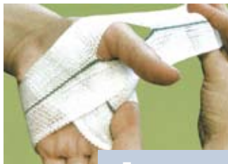
Бинт медицинский эластичный фиксирующий вязаный

С учетом сказанного, на «Ленте» остается лишь строить догадки по поводу причин существующей настороженности в отношении заведомо предпочтительной продукции. Пищи для размышлений добавляет подмеченный факт: в сельских районных больницах к новым перевязочным материалам проявляют большой интерес. Там сразу оценили, что современные изделия избавляют от необходимости нарезать бинты и складывать салфетки вручную. Возможно, это объясняется тем, что в глубинке дефицит кадров ощущается значительно острее. Соответственно, на местах задействовать людей со специальным образованием для выполнения неквалифицирован-