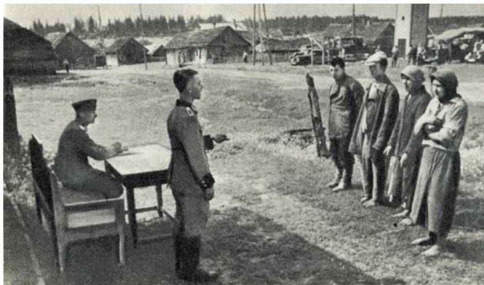
Фашистские каратели ведут допрос мирных жителей. Сентябрь 1943 года

В указанный период еще более усилилось ограбление оккупационными властями захваченных земель БССР. В крупных городах, рабочих поселках и во многих сельских районах начался настоящий голод. На проходившем в Орше весной 1943 года совещании штаба войск группы армий «Центр» генерал-квартирмейстер Вагнер констатировал: «Вопрос снабжения гражданского населения продуктами питания является катастрофическим... Население может получать лишь жалкий минимум для поддержания существования. При этом более или менее сносным является положение в сельских местностях.