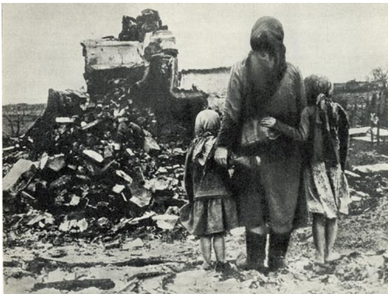
Все, что осталось от дома. Жители д. Брусы Мядельского района бывшей Вилейской области на пепелище деревни, сожженной немецко-фашистскими захватчиками. Сентябрь 1943 года

Операция «Зимнее волшебство» была осуществлена в феврале – марте 1943 года на территории Дриссенского, Освейского, Полоцкого, Россонского районов Витебской области силами боевых групп Иссерштедта, Шредера, Кнехта, подразделений 3-й танковой армии и полицейских батальонов СС: 15-й, 16-й, 17-й, 265-й, 206-й «Е», 273-й, 276-й, 277-й, 278-й, 279-й, 280-й, 281-й, 282-й, 289-й латышские, 50-й украинский, 2-й и 251-й литовские, 265-й эстонский. Руководил операцией обергруппенфюрер СС генерал полиции Ф. Ёккельн. Непосредственно боевые действия проводились с 14 февраля по 30 марта 1943 года. В осуществлении операции были задействованы авиация, артиллерия и танковые