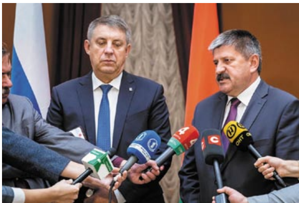
Сотрудничество регионов-соседей – всегда актуальная тема

техники продали уже на 2,36 млрд рублей – на 17,6 % больше, чем за тот же период 2020-го. И продолжают динамично прибавлять на фоне растущего спроса на комбайны – повсеместного.