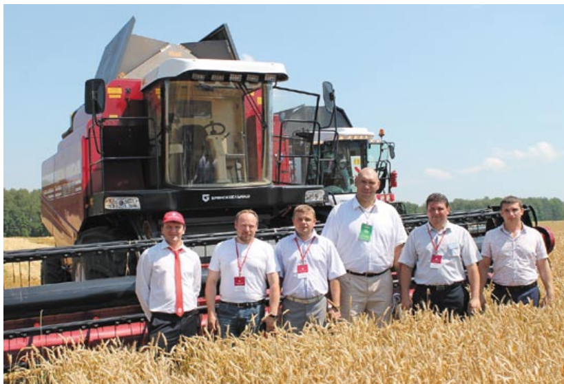
Рядом с популярной моделью «Десна-Полесье GS12A1» Николай Валуев позировал на агровыставке «День поля». Тогда еще в статусе депутата Госдумы

Кроме прочего, на той сентябрьской встрече были четко обозначены ключевые интересы обоих регионов. Помимо комплектующих для сельхозтехники, Брянщина активно закупает у гомельских партнеров комплектующие для железнодорожных локомотивов, картон и бумагу, в том числе обойную, молочную продукцию, мясо крупного рогатого скота и соль.