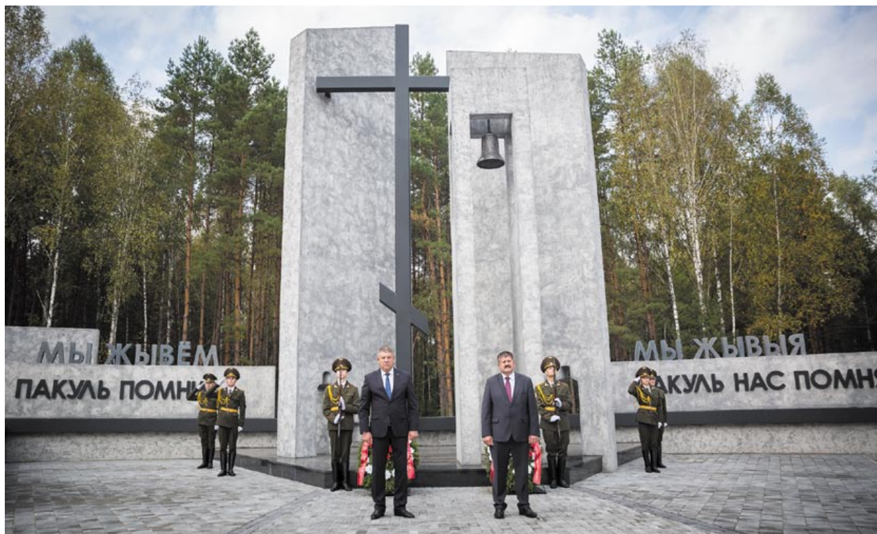
Во время посещения мемориала на месте сожженной фашистами деревни Ола Светлогорского района Гомельской области