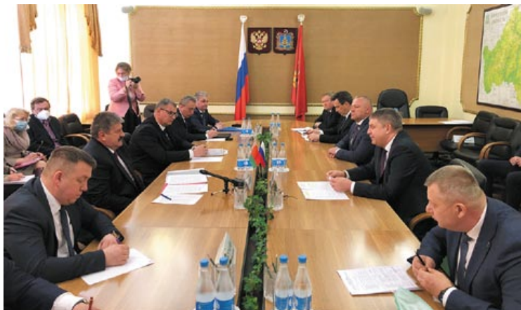
Во время встречи в Правительстве Брянской области. Апрель 2021 года

и компанией «Гомельоблпищепром» разрабатывают инновационные технологии для получения экологически безопасной продукции растениеводства. Брянский государственный инженерно-технологический университет сотрудничает с упомянутым университетом имени Ф. Скорины и Белорусским государственным университетом транспорта (Гомель). Юноши и девушки из обеих областей регулярно участвуют в молодежных форумах, студенческих фестивалях, туристско-патриотических слетах.