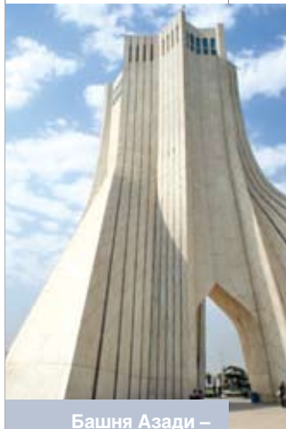
Башня Азади – символ Тегерана

Ну а теперь поговорим о мифах, плотной стеной окружающих Иран в глазах жителей планеты. Один из самых распространенных гласит: ислам агрессивно подавил в стране все остальные религии. Так ли это на самом деле? Мне, как христианке, было особенно интересно выяснить – могут ли мои единоверцы в Иране исповедовать свою религию? Может, они молятся тайно, в темных полуподвальных помещениях? Или даже такой возможности у них нет? Каково же