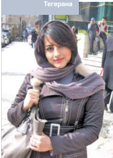
Молодая жительница Тегерана

Под запретом в Иране и наркотики – наказание за их распространение предусмотрено вплоть до смертной казни. Та же ситуация с сексуальными меньшинствами. Правильно все это или неправильно – не нам судить. Но, надо думать, у такой на-