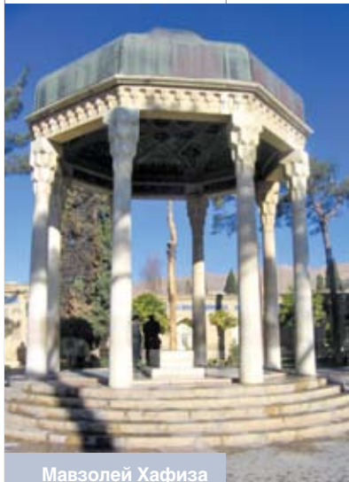
Мавзолей Хафиза в центре Шираза

Так называемый «старый город» – это что-то потрясающее. Целые улицы «вылеплены», иначе не скажешь, из смеси глины