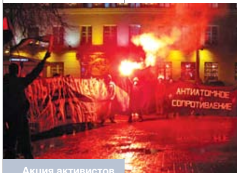
Акция активистов «Антиатомного сопротивления» у кинотеатра «Октябрь» в Минске. 20 февраля 2010 года

До последнего времени отделение НБП в Беларуси было в целом позитивно настроено в отношении к властям. Однако в марте 2010 года белорусские нацболы заявили о переходе в оппозицию [16].