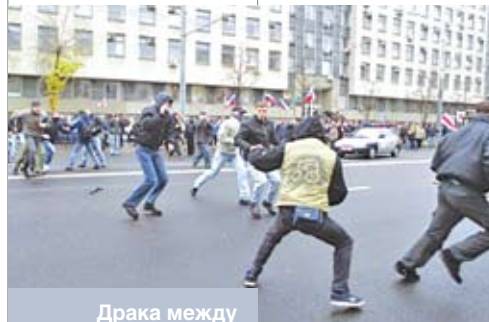
Драка между молодежными формированиями «Белая воля» и «Антифа» в Минске. 4 ноября 2009 года

Вероятно, не случайно, что в ходе выборов в местные Советы депутатов активисты МРФ пытались приобрести самостоятельный опыт участия в избирательной кампании. Например, «Молодой фронт» участие в выборах рассматривает как платформу для того, чтобы молодые лидеры, новые активисты учились работе с людьми, что поможет им в дальнейшей политической борьбе [9]. Любопытно, что некоторые активисты