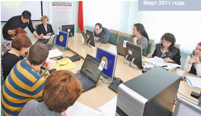
Онлайн-конференция «Все о пенсиях» проходит на сайтах информационного агентства БелТА и Министерства труда и социальной защиты Беларуси. Март 2011 года

Вспомним, что главнейшим катализатором недовольства граждан стран Евросоюза предполагаемыми реформами стала политика «двойных стандартов» национальных правительств. На поддержку банков, крупных корпораций из бюджетов государств уходят миллиарды долларов, в то время как социальные программы повсеместно попадают под сокращение. Рассуждая о создании условий для роста экономики, власти пытаются спасти прибыли