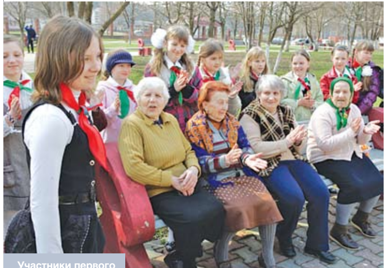
Участники первого республиканского слета тимуровских отрядов «Тимуровцы.by» в Доме-интернате для пенсионеров и инвалидов Минска

Развитие социального страхования в Республике Беларусь необходимо направить на обеспечение гарантий по защите населения от социальных и профессиональных рисков, сопряженных с утратой заработка, работы или здоровья, формирование достаточной экономической базы для возмещения основных социальных страховых рисков. В области организации системы социального страхования необходимо решить две важнейшие задачи: обеспечить объективную оценку, учет и анализ уровня и факторов социального риска для различных категорий работников и добиться