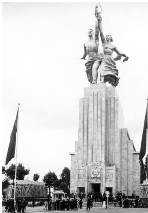
► Павільён СССР. Парыж, 1937 год

Нягледзячы на гучнае савецка-германскае ідэалагічна-мастацкае супрацьстаянне, большая частка экспазіцыі Парыжскай сусветнай выставы 1937 года, як і экспазіцыі ўсіх яе папярэднікаў, была прысвечана