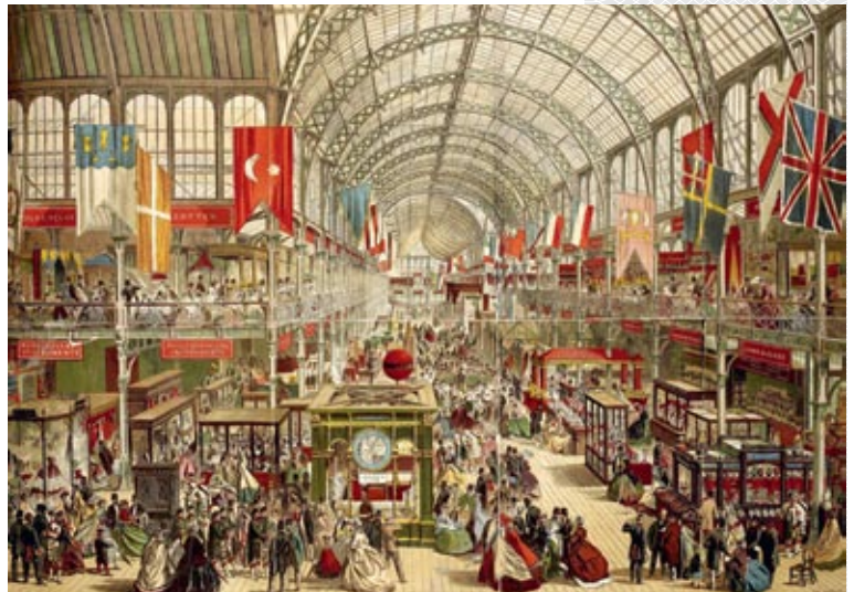
▲ Экспазіцыя Лонданскай сусветнай выставы 1851 года

Да канца XIX стагоддзя Расійская імперыя на міжнароднай арэне фарміравала ўласны імідж як прамысловай дзяржавы. На сусветнай «калумбай» выставе 1893 года ў Чыкага, прысвечанай 400-годдзю адкрыцця Амерыкі, паказвалася разнастайнасць расійскіх прамысловых тавараў, у т.л. вырабленых на гродзенскім спіртзаводзе І.Л. Шарашэўскага, пінскім хімічным заво-