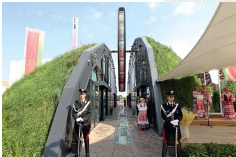
▲ Нацыянальны павільён Беларусі на ЭКСПА-2015 у Мілане

У беларускім нацыянальным павільёне адбылася прэзентацыя прадукцыі больш як 100 айчынных прадпрыемстваў АПК, праводзіліся семінары, майстар-класы, дэгустацыі, дні беларускай навукі, эканомікі і г.д. 9 верасня нацыянальны Дзень Беларусі на ЭКСПА-2015 адкрыў прэм'ер-міністр Андрэй Кабякоў. Ён, у прыватнасці, сказаў: «Наведвальнікі павільёна Рэспублікі Беларусь бачаць наш вытворчы, турыстычны і культурны патэнцыял, яны бачаць, што