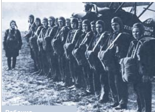
Рабочие на занятиях Осоавиахима. Иваново. 1932 год

подготовки и применения сил и средств воинских частей и подразделений территориальных войск. К воинским частям относятся отдельные стрелковые батальоны и отдельные стрелковые роты территориальных войск. Как правило, батальон состоит из управления, основных подразделений и подразделения обеспечения. К основным подразделениям относятся стрелковые роты и роты огневой поддержки. А к подразделениям обеспечения – инженерно-саперная рота, разведывательный взвод, взвод связи, взвод материально-технического обеспечения, автомобильный взвод и взвод охраны.