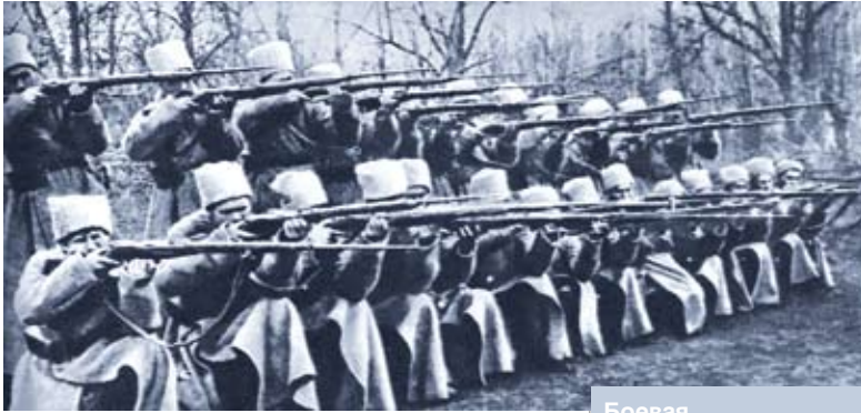
Боевая подготовка частей территориальных войск. 1922 год

Минску. Начальником зоны территориальной обороны является председатель облисполкома, а также председатель Минского горисполкома, которые в военное время возглавляют соответствующие советы обороны. Начальником штаба – заместителем начальника зоны является военный комиссар военного комиссариата области и города Минска. Начальниками районов также назначаются председатели соответствующих исполнительных комитетов, главы местной администрации. В военное время они возглавляют советы обороны районов и подчиняются соответствующему начальнику зоны. Начальником штаба – заместителем начальника района является соответствующий районный или городской военный комиссар. Начальники зон и районов несут персональную ответственность за организацию территориальной обороны, им подчиняются территориальные войска, а также другие силы территориальной обороны, расположенные в зоне и районе.