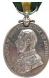
Медаль за службу в территориальных войсках Великобритании

охрана стратегических объектов и элементов военной и гражданской инфраструктуры, собственно ведение территориальной обороны.