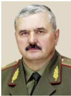
Леонид МАЛЬЦЕВ, Государственный секретарь Совета Безопасности, генерал-полковник

Система территориальной обороны Беларуси начала создаваться 10 лет назад. Это был период смелых экспериментов, научных исследований и учений, позволивших обосновать наиболее перспективные направления военного строительства, укрепления обороноспособности страны, в том числе путем создания принципиально новой системы территориальной обороны. Уже в 2002 году в ходе оперативно-тактического учения «Березина-2002» впервые были отработаны практические действия территориальных войск в Борисовском районе. События, происходящие в мире на протяжении последних лет, лишь подтверждают правомерность принятых тогда решений.