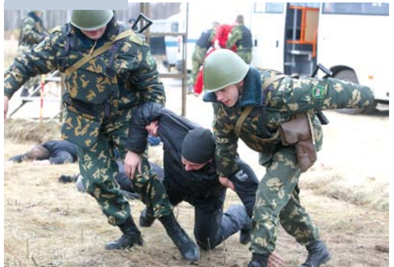
Учения по территориальной обороне на Гожском полигоне. 2011 год

Для каждого бойца территориальных войск генерал-губернатор является прямым начальником, командиром, отвечающим за выполнение боевых задач. А централизация руководства по всей вертикали военного управления является основой успешного выполнения этих задач в любых условиях. Губернатор и в мирное, и в военное время несет личную ответственность за стабильную, бесперебойную работу предприятий, учреждений, коммуникаций, за жизнь и здоровье людей в своем регионе. И эта стабильность достигается, прежде всего, тесными контактами в системе управления и взаимодействия на территории области или района. Немаловажным фактором, напрямую влияющим на слаженность действий территориальных войск, других войск и воинских формирований, является равноправное взаимодействие всех субъектов военных действий, когда генерал –