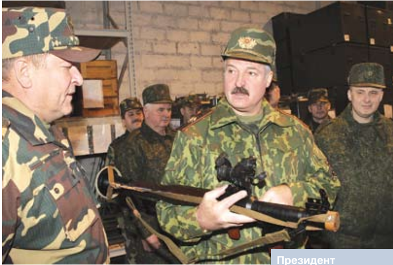
Президент Беларуси Александр Лукашенко считает территориальные войска эффективным средством обороны государства

ме обеспечения военной безопасности важная роль отведена территориальной обороне. Глава государства подчеркнул, что именно «системная подготовка территориальных войск послужит хорошим подспорьем для дальнейшего развития военного потенциала государства, усилит значимость Вооруженных Сил, которые должны играть ключевую роль в обеспечении безопасности страны».