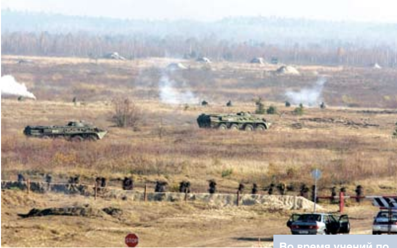
Во время учений по территориальной обороне на Гожском полигоне. 2011 год

командующий видом, родом войск, оперативным направлением руководит этими действиями совместно с таким же, как и он, генералом – начальником зоны территориальной обороны.