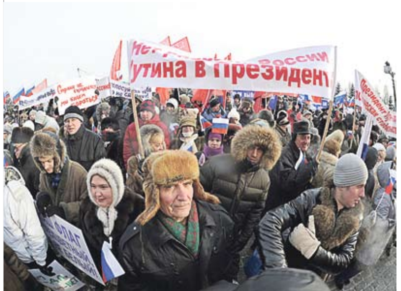
Митинг на Поклонной горе в Москве

начала бы бить в первую очередь не представителей власти, а самих «пингвинов» и «пингвиних» в норковых шубах как социально чуждых, – и правильно сделала бы. Либеральной тусовке, наиболее активную