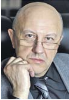
Андрей ФУРСОВ, историк, социолог, публицист (Россия)