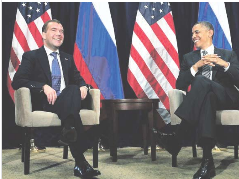
Во время совместного выступления Б. Обамы и Д. Медведева перед журналистами в верхах АТЭС в Гонолулу. Ноябрь 2011 года

Не буду вспоминать о том, как Запад обманывал СССР, а затем Россию по вопросу о членстве восточноевропейских стран и бывших советских республик в НАТО. Поговорим о конкретно-личном аспекте. В XXI веке западные верхушки физически уничтожают негодных им лидеров – и тех, которых они свергают, и тех, которые, как этим лидерам казалось, договорились с Западом о своем будущем. Это – Милошевич, Хусейн, Каддафи, Мубарак и Бен Али (двум последним еще повезло, впрочем, надолго ли?).