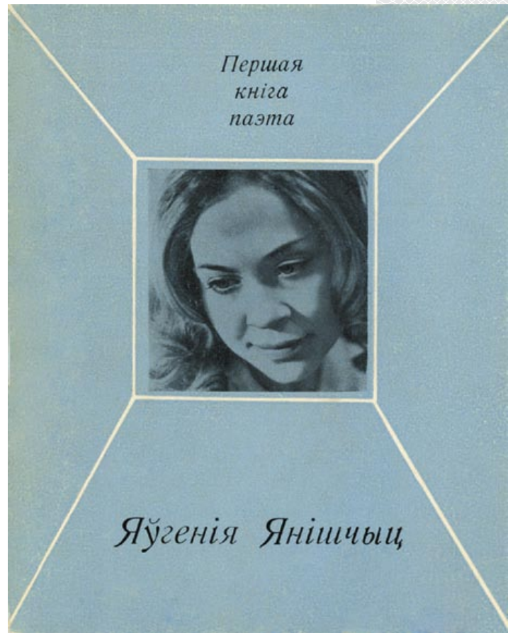
▲ Вокладка першай кнігі Я. Янішчыц «Снежныя грамніцы»

Падлеткі яе выцягнулі, адкачалі. Калі прыбегла маці, нехта з іх зазначыў: «Цётка Марыя, яна маўчыць, як на тым свеце пабывала». Хто ведае, магчыма, і сапраўды так было. Містыкі сцвярджаюць: тым, хто перажыў клінічную смерць, часта адкрываецца асаблівы дар. Гэтыя людзі па-іншаму пачынаюць успрымаць свет. Пэўна, і нам нельга ігнараваць гэты факт з біяграфіі Я. Янішчыц. Марыя Андрэеўна ўспамінала, што Жэня часта сядзела каля таго віру, глядзела на ваду і аб нечым сваім думала. А на матчыны страхі-хваляванні адказвала: «Ведаеш, матуля, так цягне, там такая бездань, аблокі ў ім (у віры. – Т.А.) плывуць, як недзе ў другім жыцці. Там нават і не вада зусім, а нешта такое, магнітнае». Здаецца, што і на фотаздымку на вокладцы зборніка «Снежныя грамніцы» паэтэса глядзіць акурат у той самы ясяльдзянскі вір.