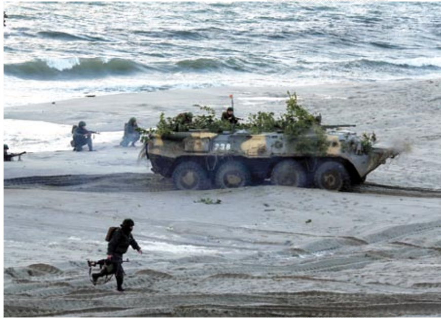
▲ Учение на полигоне Хмелевка

В сложившейся по сценарию учения обстановке, в Вооруженных Силах Республики Беларусь оперативно была проведена подготовка к развертыванию основных оборонительных сил для отражения возможной агрессии и проведения контртеррористической операции.