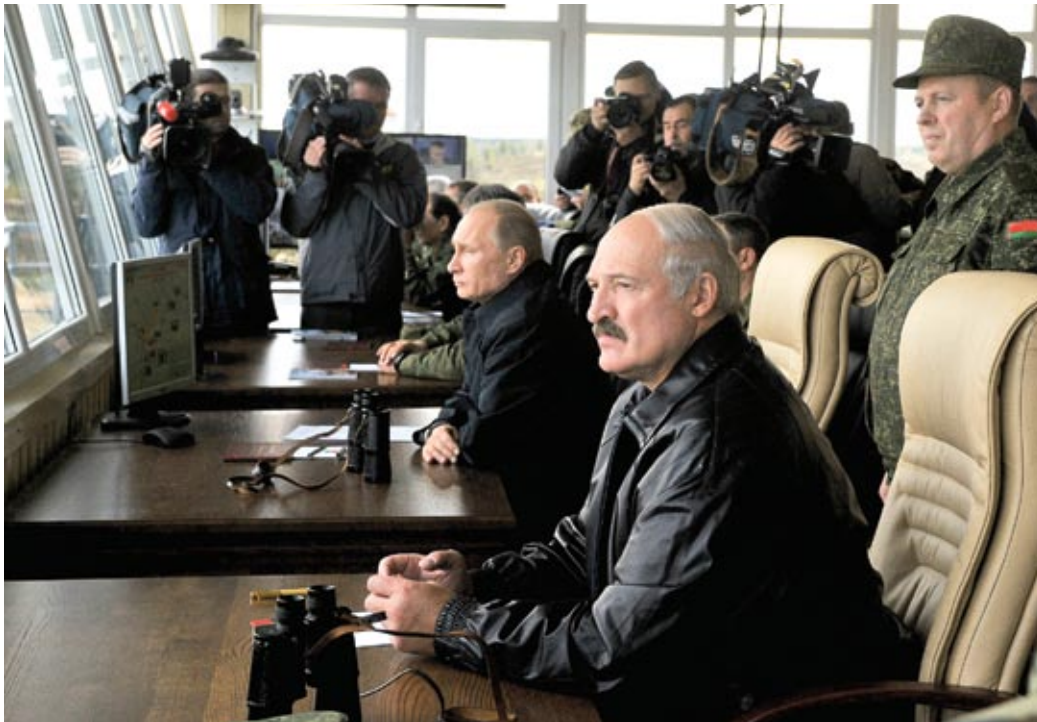
◀ Президенты Беларуси и России Александр Лукашенко и Владимир Путин наблюдают за завершающим этапом учения «Запад-2013» на Гожском полигоне

2013» была неоднократно поддержана и российской стороной. По этому поводу высказывались и руководство страны-союзницы, и представители высшего командования Вооруженных Сил Российской Федерации. Однако в государствах блока НАТО это предпочли не услышать и развернули вокруг плановых белорусско-российских маневров масштабную, мягко говоря, дискуссию.