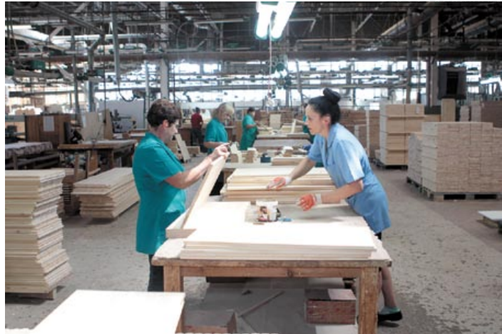
▲ Белорусско-германское производственное совместное предприятие «Минский мебельный центр» в Молодечно

ставили минеральные продукты (50,2 %). Также поставлялись недорогие металлы и изделия из них (13,2 %), про-