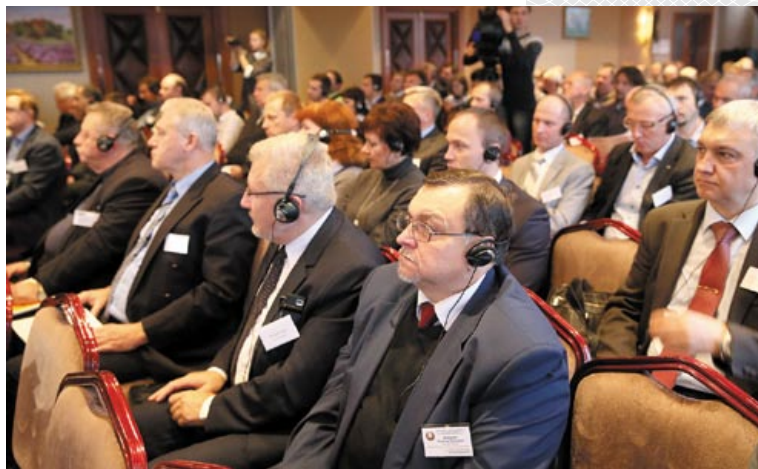
◀ На V Белорусско-германском энергетическом форуме в Минске. 2016 год

Среди наиболее значимых инвестпроектов, реализуемых либо прорабатываемых с германскими фирмами на территории нашей страны в настоящее время, следует выделить строительство Слуцким сахарорафинадным комбинатом совместно с компанией Uniferm GmbH und Co.Kg дрожжевого завода в городе Слуцке, а также возведение предприятия по производству металлического листа и белой жести мощностью 200 тыс. тонн продукции в год в Миорском районе Витебской области. Инвестором второго