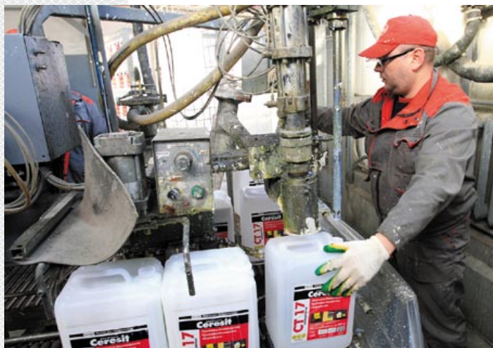
▼ Производство СООО «Хенкель Баутехник»

В ФРГ свою деятельность осуществляют и представительства шести белорусских субъектов хозяйствования. Это – фирма BELASTAHL Außenhandel GmbH, которая, являясь дочерним предприятием Белорусского металлургического завода, поставляет на германский рынок отдельные виды металлопродукции: металлокорд, проволоку, круглую сталь, стальную фибру и др. Сельскохозяйственной техникой, произведенной на ПО «Минский тракторный завод», торгует в Германии фирма BELIMPEX Handels-GmbH, а продукцией всем из-