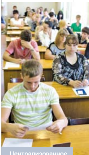
Централизованное тестирование в одном из вузов Минска

Понятно, что, кроме индивидуализации предоставляемых знаний и курсов, необходимо обращать внимание на персональный, зачастую опережающий контроль прохож-