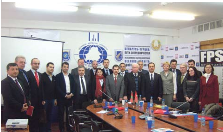
На 2-й міжнароднай навукова-практычнай канферэнцыі «Беларусь – Турцыя: шляхі супрацоўніцтва»

– Тое, пра што вы кажаце, можна парознаму назваць: новая сіла рэгіёна, новы лідар. Але гэта моц, уплыў з’явіліся не знянацку, а сталі вынікам пэўнага гістарычнага працэсу. Нельга казаць, што мы ставілі такую мэту «стаць лідарам рэгіёна», але развіццё нашай краіны прывяло да таго, што мы дасягнулі таго ўплыву, які маем зараз. Ды і што такое гэта лідарства? Турцыя вельмі адрозніваецца ад Ірана, ад арабскіх краін. Я добра знаёмы з сітуацыяй у краінах Усходу. Два гады я пражыў у Лівіі, чатыры гады – у рэгіёне Персідскага заліва. Даводзілася быць і ў Егіпце, і ў Тунісе. Усе гэтыя арабскія краіны настолькі розныя, што нават мова ў