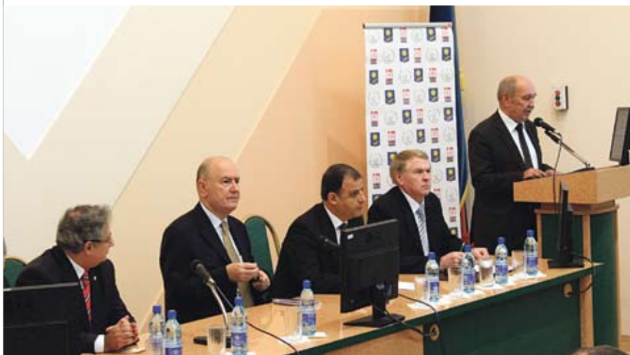
У Міжнародная навукова-практычная канферэнцыя «Педагагічная адукацыя ва ўмовах трансфармацыйных працэсаў: метадалогія, тэорыя, практыка»

– Ёсць пэўныя працэдурныя і тэхнічныя пытанні. Гэтае пагадненне павінна быць ухвалена парламентамі дзвюх краін, што зойме пэўны час. Для беларусаў яго ўвядзенне будзе мець больш сімвалічнае значэнне. Вашы грамадзяне ўжо цяпер могуць атрымаць візу непасрэдна ў аэрапорце па прылёце ў Турцыю. Вельмі добра развітая (і гэты працэс працягваецца) турыстычная інфраструктура прыцягнула да сябе ўвагу беларускіх турыстаў: наша краіна стала адным з найбольш папулярных месцаў адпачынку. Апошнім часам штогод каля 150 тысяч беларусаў прылятаюць у Турцыю. Нягледзячы на тое, што гэта колькасць можа здацца невялікай на фоне агульнай колькасці