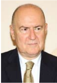
Джэват Незіхі АЗКАЯ, Надзвычайны і Паўнамоцны Пасол Турэцкай Рэспублікі ў Рэспубліцы Беларусь

З Надзвычайным і Паўнамоцным Паслом Турэцкай Рэспублікі спадаром Джэватам Незіхі Азкая мы сустрэліся якраз на Наўруз. І хоць гэтае старажытнае свята не такое папулярнае ў Турцыі, як на Сярэднім Усходзе, тым не менш сустрэча адразу набыла нейкія светлыя і сяброўскія рысы. Ды і нагода для свята ёсць усё роўна – менавіта ў гэтым годзе адзначаецца 20-годдзе ўсталявання дыпламатычных адносін паміж Беларуссю і Турцыяй. Гэта і была падстава для размовы, якая значна выйшла за межы простага юбілейнага інтэрв'ю.