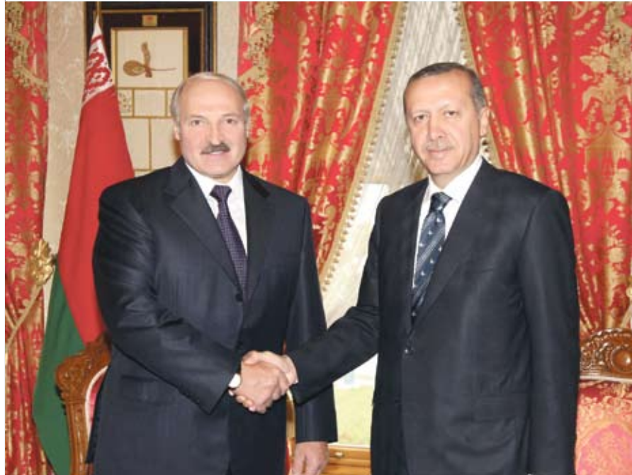
Сустрэча Прэзідэнта Беларусі Аляксандра Лукашэнкі з прэм'ер-міністрам Турцыі Рэджэпам Таіпам Эрдаганам. Стамбул, 2010 год

і выкінуць зброю. Тут вельмі важна зразумець другі бок, чаму ён прытрымліваецца пазіцыі, з якой ты не згодны. Асабліва гэта важна на стадыі перамоваў. Напрыклад, Расія па-ранейшаму падтрымлівае рэжым Башара Асада – мы павінны зразумець і гэ-