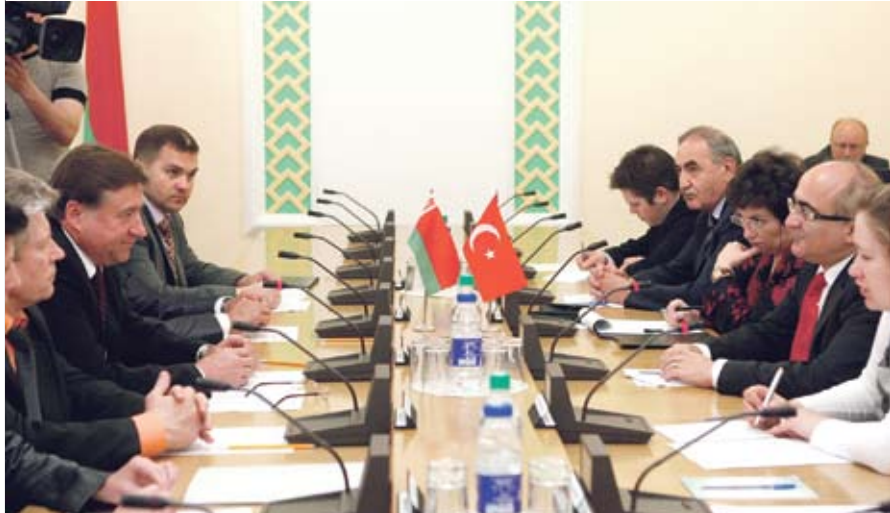
У час сустрэчы міжпарламенцкай групы дружбы «Турцыя – Беларусь». 2010 год

– Турцыя, дарэчы, стала адной з першых краін, што прызналі незалежнасць Беларусі. Дыпламатычныя адносіны паміж дзяржавамі былі ўсталяваны 25 сакавіка 1992 года. І ў гэтым годзе мы адзначаем