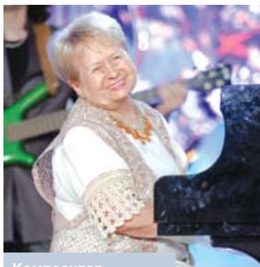
Композитор Александра Пахмутова