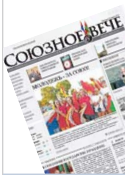
Газета Парламентского собрания Союза Беларуси и России «Союзное вече»