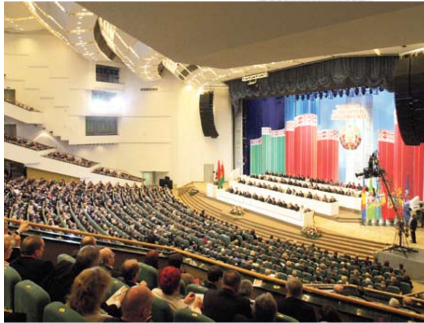
▲ На IV Всебелорусском народном собрании. 2010 год

С началом перестройки и особенно после распада Советского Союза в большинстве бывших советских республик происходит стремительная эмансипация гражданских институтов от повседневного вмешательства государства в их деятельность. 1990-е и последующие годы были отмечены лавинообразным ростом числа различного рода общественных объединений граждан. Например, ныне в Республике Беларусь зарегистрировано 15 политических партий, 35 профсоюзов, 25 союзов (ассоциаций) общественных объединений, 7 республиканских государственно-общественных объединений и более 2,3 тыс. других объединений граждан [3, с. 25]. Еще в 1999 году на проходившей в Минске международной научно-практической конференции «Становление гражданского общества в Бела-