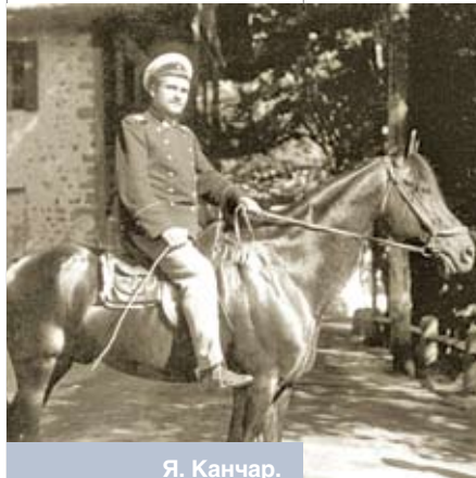
Я. Канчар. Баржом, 1908 г. НАРБ

Біяграфічная канва яго жыцця сёння вядомая. Яшчэ ў 1998 годзе была надрукавана аўтабіяграфія, напісаная ў 1913 годзе для біябібліяграфічнага слоўніка прафесара С. Вянгерава («Голас Радзімы», 5 сакавіка), даведкі пра Я. Канчара можна прачытаць у энцыклапедычных выданнях, кнізе «Памяць» Лоеўскага раёна. Яўсей Канчар – асоба яркая і самабытная. У гісторыю (прынамсі, паводле 6-томнай «Энцыклапедыі гісторыі Беларусі») ён увайшоў як беларускі палітычны дзеяч, гісторык, публіцыст, вучоны ў галіне эканамічнай геаграфіі. Нарадзіўся ў сялянскай сям’і. У пачатку стагоддзя жывіў у Тыфлісе, за ўдзел у рэвалюцыйным руху ў 1906 годзе арыштаваны. З 1910 года ў Пецярбургу, далучыўся да кааператывнага руху, у 1913 годзе выдаў дапаможнік «Кіраўніцтва па сельскай кааперацыі». Падтрымліваў сувязь з газетай «Наша ніва», дзе надрукаваў артыкул «Што такое кааперацыя» (1912, № 6). У рэвалюцыйным 1917-м стаў сябрам створанага ў Мінску Беларускага нацыянальнага камітэта. У лістападзе быў абраны старшынёй Беларускага абласнога камітэта пры Усерасійскім Савеце сялянскіх дэпутатаў у Петраградзе. У снежні 1917 года ў Мінску распачаў працу Усебеларускі з’езд (кангрэс), які павінен быў выявіць волю беларускага народа па пытанні дзяржаўнага ўладкавання роднага краю.