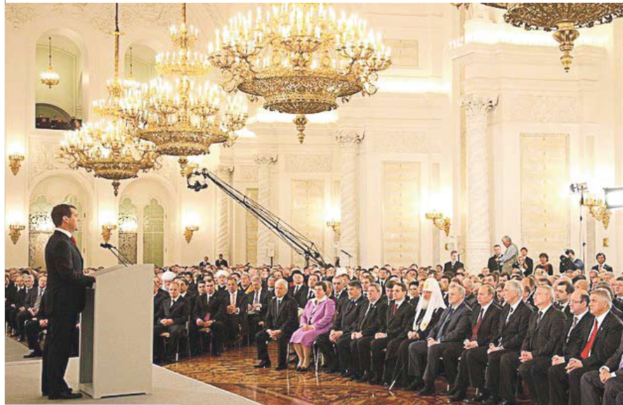
Выступление президента России Д.А. Медведева с ежегодным Посланием Федеральному Собранию

модернизации и ее ключевой цели – обеспечении высокого качества жизни населения. Больше или меньше согласие российско-го экспертного сообщества наблюдается и в отношении стратегических инструментов реализации намеченного, среди которых обычно называются расширение частной инициативы и конкуренции при эффективном взаимодействии государства, бизнеса, общества; сильное и эффективное государство с институтами высокого качества (защищенность собственности, независимость и неподкупность судей, снижение уровня коррупции, соблюдение законов); эффективная социальная политика.