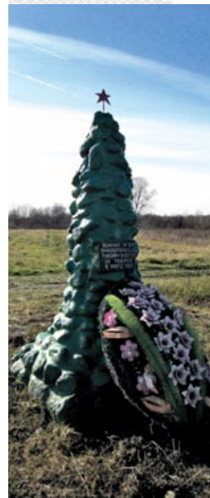
▲ Обелиск на месте боев у реки Черногостицы. Бешенковичский район