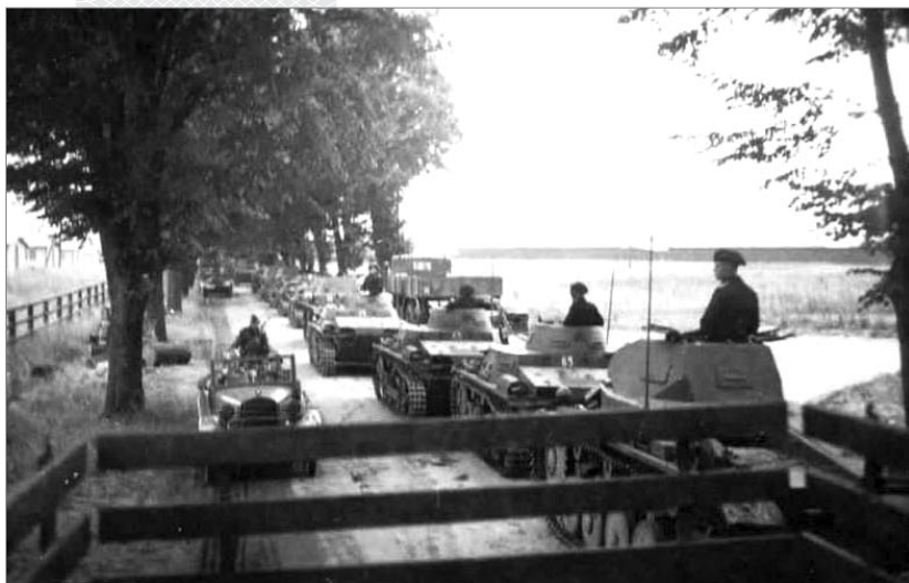
▼ Армада фашистских танков в районе Сенно. Июль 1941 года

Военные стратеги и историки в последнее время среди причин неудачи Лепельского контрудара называют следующие: слабая подготовка операции и отсутствие времени на получение необходимой разведывательной информации; очень плохо налаженная связь, в результате чего участникам контрудара зачастую приходилось действовать вслепую; значительной части советских танкистов пришлось вступать в бой буквально сразу же по прибытию на новое место дислокации; крайне неважно был обеспечен подвоз топлива и боеприпасов. Роковую роль сыграло и отсутствие боевого опыта, ведь для большинства солдат и младшего командного состава бои в районе Сенно стали боевым крещением. А ведь приходилось противостоять уже изрядно «обстрелянному» в европейских сражениях врагу. Кроме того, по многим параметрам советская техника уступала боевым машинам противника: устаревшие танки Т-26, БТ-5, БТ-7, которые были у нас на вооружении, не могли успешно противо-