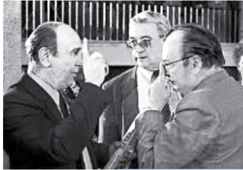
Публицисты Юрий Черниченко, Егор Яковлев и Николай Шмелев на 19-й Всесоюзной конференции КПСС. Москва, 1988 год

Однако со временем поток подобных публикаций стал иссякать. Видный представитель писательского сообщества В. Войнович следующим образом трактовал причины утраты писателями ро-