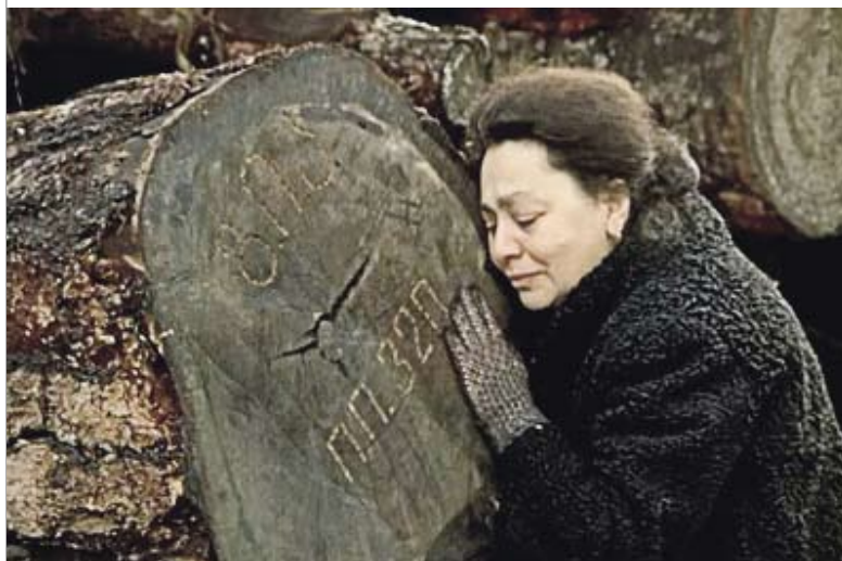
Кадр из фильма Т. Абуладзе «Покаяние»

Активное внедрение в практику общественной жизни подобного принципа должно было способствовать осознанию населением необходимости радикальных изменений в политической сфере. Гласность означала раскрытие недостатков и пороков, мешавших реализации «потенциала социализма». Предполагалось провести контролируемое «сверху» смягчение цензуры в отношении СМИ, ликвидировать спецхраны в библиотеках, опубликовать запрещенные ранее произведения и т.п. По замыслу инициаторов перестройки, значи-