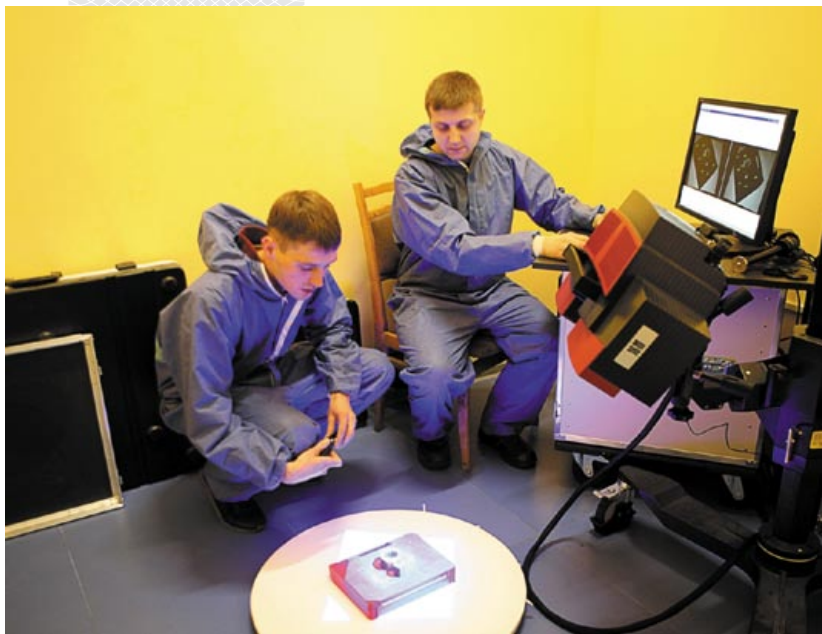
▲ В НАН Беларуси проходил Восьмой научно-производственный семинар «3D-принтеры: перспективы применения и развития». 2017 год

ленности и в коммерческой сфере. В Государственном научно-производственном объединении порошковой металлургии НАН Беларуси активно разрабатываются приемы 3D-печати с использованием порошков в полимерных, металлополимерных, металлических и металлокерамических сплавах. Изделия, созданные по аддитивным технологиям, применяются в промышленности, в том числе в таких высокотехнологичных отраслях, как авиационная и космическая, в медицине изготавливают имплантаты и инструменты, хорошие перспективы видятся и в травматологии, ортопедии, челюстно-лицевой хирургии.