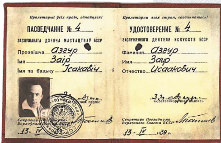
▲ Пасведчанне заслужанага дзеяча мастацтваў Беларускай ССР, выданае З. Азгуру за № 4 у красавіку 1939 года

Другі такі выпадак адбыўся з Азгурам у канцы 1940-х. Пасля абвешчання Дзяржавы Ізраіль скульптар глыбока пранікся ідэямі сіянізму, стварыў некалькі работ у гонар дзеячаў яўрэйскай культуры. Сярод іх быў і паўфігурны партрэт савецкага тэатральнага акцёра і рэжысёра, грамадскага дзеяча Саламона Міхоэлса з дзіцем на руках. Але позна вечарам 12 студзеня 1948 года негалосны лідар яўрэйскага руху ў СССР быў забіты ў час гастроляў у Мінску супрацоўнікамі Міністэрства дзяржаўнай бяспекі, якія замаскіравалі сваё злачынства пад дарожна-транспартнае здарэнне. Назаўтра зранку, пакуль навіна пра смерць С. Міхоэлса не атрымала шырокай агалоскі, у майстэрню да З. Азгура заявіўся яго добры знаёмы – першы намеснік старшыні Савета Міністраў БССР Пётр Абрасімаў і параіў далей ад граху знішчыць бюст трапіўшага ў няміласць да Сталіна акцёра. «Як пакутавала мая душа, калі мяне вымушалі ўшчэнт разбіць першы мой партрэт Міхоэлса, зроблены адразу пасля вайны, – успамінаў Заір Ісакавіч. – Мне была вельмі дарагая постаць гэтага мудрага яўрэя з чэрапам мысліцеля і вачыма добрага бацькі, які трымае на руках дзіця негроіднай расы. Мне верылася, што так я адлюстроўваю інтэрнацыянальны дух