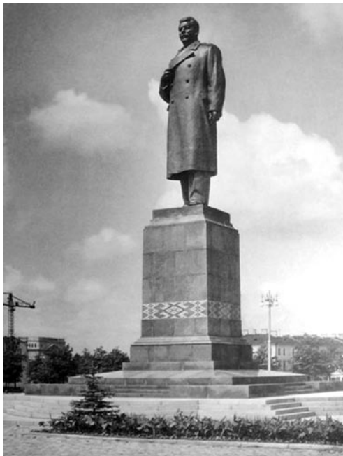
► Помнік І. Сталіну ў Мінску. 1950-я гады

Паводле сведчання вучняў народнага мастака, сам ён па-рознаму расказваў гісторыі пра работу над сталінскімі выявамі. Адна з іх звязана з працай над скульптурай «Генералісімус Сталін», якая была заказана маладому З. Азгуру для мастацкай выставы ў маскоўскім Манежы. Скульптар задумаў паказаць правадыра ва ўрачыстай сядзячай паставе. Але выйшла нечаканая закавыка: на што пасадзіць Сталіна, не на табурэтку ж? І тады Азгур зрабіў адмысловае крэсла. Гэтае самае крэсла зламаныкі і зайздроснікі паспрабавалі выкарыстаць, каб падсезець самога творцу. Напісалі данос, што З. Азгур вылепіў Сталіна ў выглядзе рымскага імператара на троне, а не як правадыра пралетарыяту. Фатаграфіі скульптуры дайшлі да Паскробышава – асабістага сакратара Сталіна. Той не пабаяўся паказаць іх свайму патрону, якому праца скульптара спадаба-