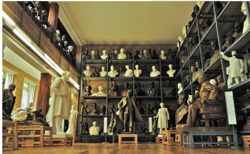
▲▼ У скульптурнай і мемарыяльнай залах Мемарыяльнага музея-майстэрні Заіра Азгура

У розныя гістарычныя перыяды ў З. Азгура былі розныя героі. Напрыклад, пасля таго як у 1942 годзе скульптара камандзіравалі з Томска, дзе знаходзіўся ў эвакуацыі, у Маскву ў Беларускі штаб партызанскага руху, ён звяртаецца да героіка-патрыятычнай тэмы. Заір Ісакавіч стварае не толькі скульптурныя выявы партызан Міная Шмырова, Ціхана Бумажкова, герояў першых месяцаў вайны Мікалая Гастэлы, Льва Даватара, Фёдара Смалячкова і многіх іншых, а звяртаецца і да беларускай мінуўшчыны. Акурат да гэтага перыяду належаць гістарычныя партрэты князёў Уладзіміра Полацкага і Васількі Мінскага ў вобразе ратнікаў, готовых бараніць сваю зямлю, а такса-