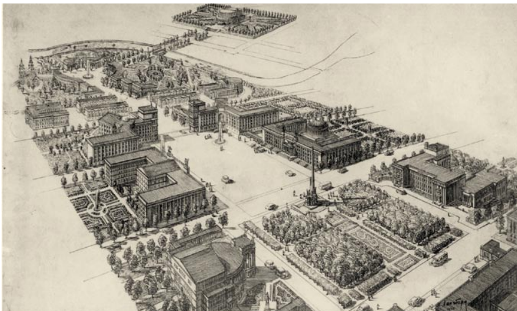
◀ Центральная площадь Минска. Конкурсный проект. 1948 год

В соответствии с генпланом жилищное строительство первой очереди планировалось в объеме 650 тыс. кв. м жилой площади, включая восстанавли-