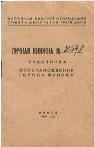
▲ Личная книжка участника восстановления Минска. Обложка

На каждого пассажира в Минске приблизительно прогнозировалось 450 по-