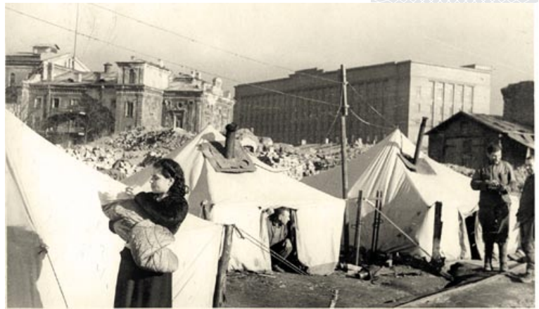
▲ Временные жилища минчан после освобождения города. Район пересечения улиц К. Маркса и Ф. Энгельса. 1944 год

Еще за два года до освобождения Минска правительством БССР была создана оперативная группа, которой поручили найти в действующей армии и в тылу архитекторов и инженеров-проектировщиков, за счет которых должен был комплектоваться проектный институт в Минске. Большую помощь в этой работе оказали архитекторы Москвы и Ленинграда. В августе 1944 года по приглашению П. Пономаренко, первого секретаря ЦК КП(б)Б в Минск прибыла специальная комиссия Комитета по делам архитектуры при СНК СССР, в составе которой были известные зодчие: академики А. Мордвинов, Н. Колли, В. Семенов, А. Щусев, профессор И. Лангбард, член-корреспондент Академии архитектуры Б. Рубаненко. Этим коллективом был подготовлен «Эскиз-идея планировки г. Минска», который лег в основу решения текущих восстановительных задач и составления первого послевоенного Генерального плана возрождения и развития города Минска. К его составлению приступили в конце 1944 года, а первая редакция была подготовлена уже через год. К апрелю 1946-го с учетом замечаний и согласований план