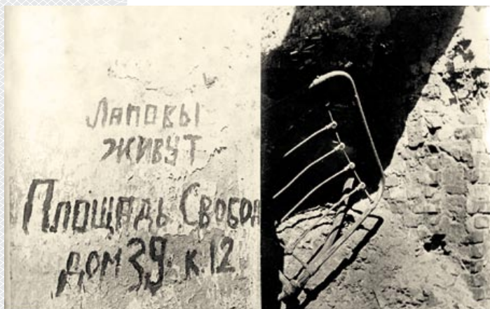
▲ Руины дома в Минске. 1944 год

(БГАНТД) на хранении имеется большой корпус документов (письменных, иллюстративных, графических), связанных с историей восстановления Минска, в том числе и первый Генеральный план (разработанный на 1946–1960 годы). Это – большой документ, который включает в себя: введение, основные положения генплана, технико-экономические основы восстановления и развития Минска (15 подразделов), характеристику природных и инженерно-геологических условий города и его окрестностей (3 подраздела), пояснительную записку (12 подразделов) и приложения. Общий объем генплана – 175 машинописных страниц текста, расчетов, схем и таблиц [9, л. 2–3].