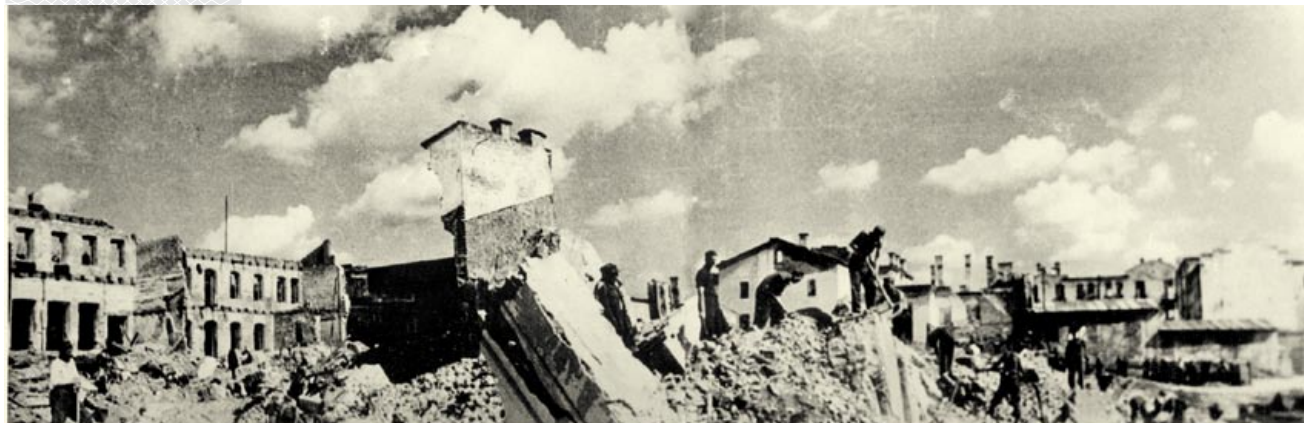
▼ Начало расчистки Минска. 1944 год

д) стройная архитектурная композиция всей застройки по ее высотности и выразительности с учетом использования интересного рельефа территории го-