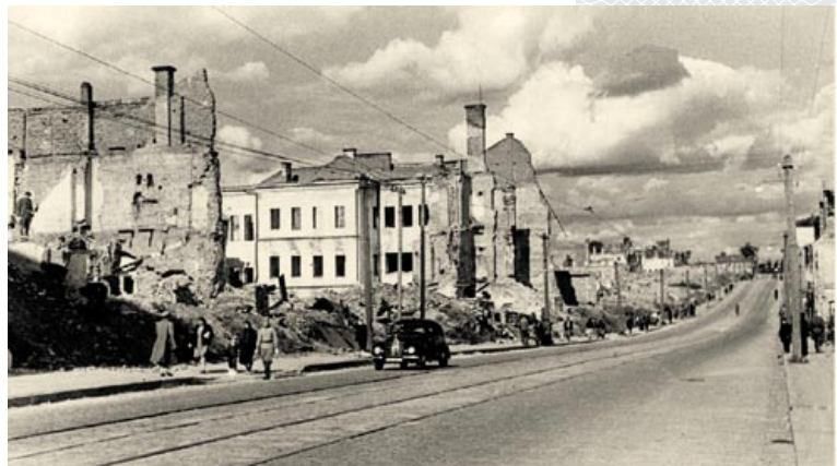
▼ На улицах Минска. 1944–1945 годы