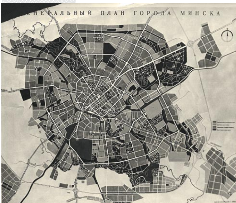
▼ Генеральный план Минска. 1946 год

Предприятия, с учетом сложившейся структуры промышленности, планировалось разместить в трех промышленных районах: