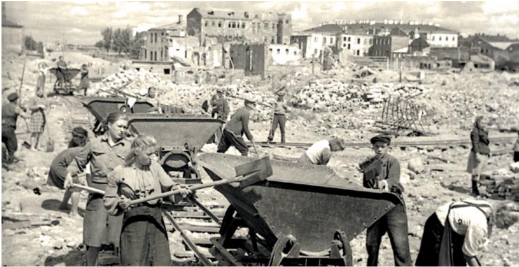
◀ Минчане разбирают разрушенные здания на улице Советской (ныне проспект Независимости). Минск. 1944 год

рода и его природных условий и создания его силуэта [9, л. 6–6 об.].