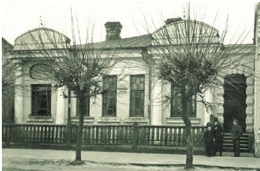
Здание Бобруйской музыкальной школы № 1. 1950-е годы