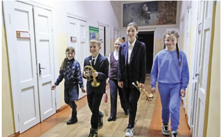
В Детской школе искусств № 1 имени Е.К. Тикоцкого ребята осваивают разные музыкальные инструменты

И продолжал писать. Новая опера, к работе над которой Тикоцкий приступил ранней весной