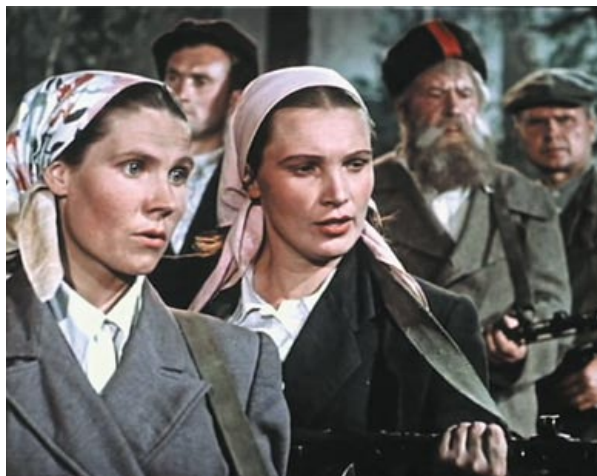
Сцена из оперы «Дзяўчына з Палесся». Хор Большого театра БССР. 1955 год